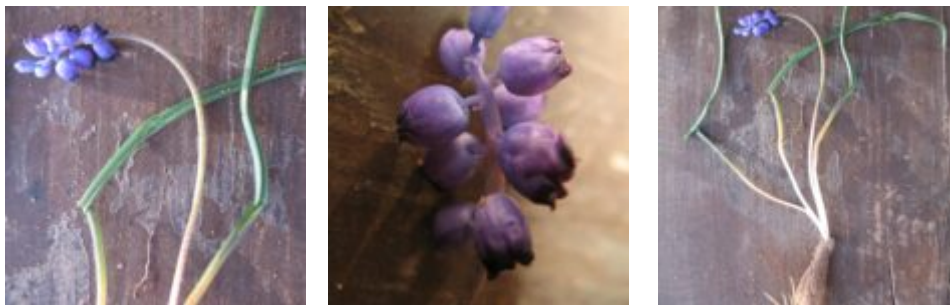
כדן נימי בראש גבל רם, 1350 מטר במרומי אזור ואדי רם בדרום ירדן. נראים העלים החוטיים, העטיף הקצר והעגול. ישנם פרטים בעלי עטיף סגול-שחור וישנם פרטים בעלי פרחים "עקרים" כחלחלים בראש התפרחת בתוך אותה אוכלוסיה, 13.9.2003.