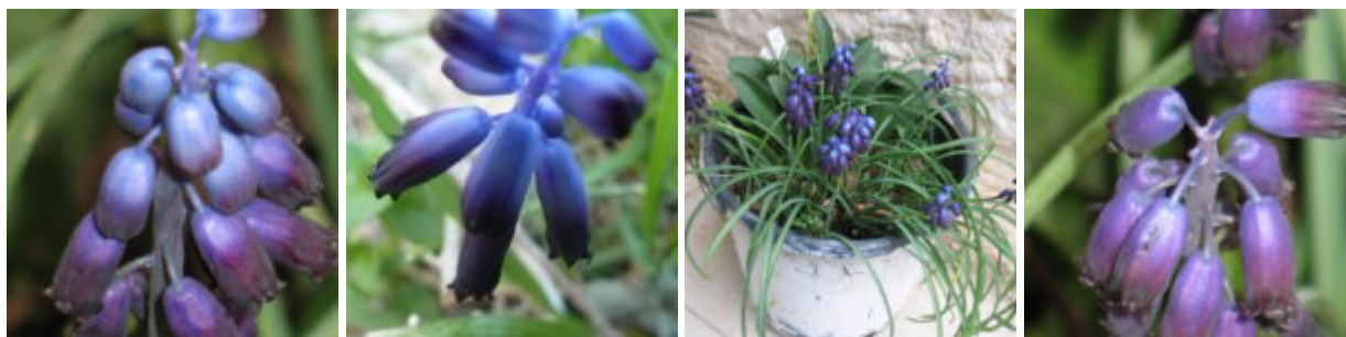
כדן סגול , השכיח במני הכדן בישראל, בעל שיני עטיף כהות ופח העטיף כמעט ואיננו משונץ. לרוב מופיעים בראש התפרחת פרחים עקרים כחלחלים בוהקים, ולכן נחשב על ידי ראוונה למין נפרד ושונה מ"כדן פעור" אשר תואר מהלבנט על ידי ריכנגר. תמונה 1,2, ו-4 מימין נלחקו מאוכלוסיית מנזר סנט-ג'ורג' בואדי קלט ותמונה מס.3 צולמה בסרטבה.