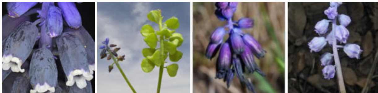
מיני הסוג כדן בישראל, מימין לשמאל: כדן קטן-פרחים (גבעת-עדה צילם עוז-גולן ©) כדן סגול (מדבר-יהודה, צלם אבנר אברהם ©), פרי אופייני בסוג כדן צורתו משולשת בחתך ולא עגולה כמו ביקינתון וביקינתונית (בר-בנגב, כדן נאה, צילם עוז-גולן ©), כדן נאה בעל שיני עטיף לבנות (צומת רימונים, צילם עוז גולן ©).

inconstrictum Rech.f. . אנו מביאים כאן תאור מפורט של כדן נימי ושלל תמונות מאתרים אחדים בו הוא גדל. כמו כן אנו מבארים את הסיסטמטיקה של כדן סגול וכדן נאה תוך אזכור מיני הכדן הנוספים שתיאר ראוונה כחדשים למדע - כדן ירושלמי וכדן המצוקים .