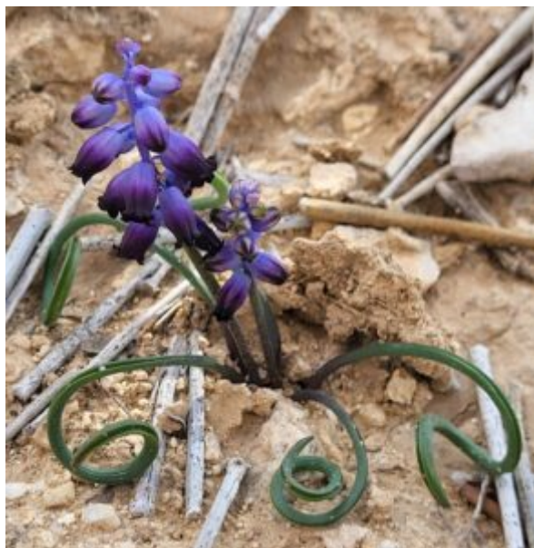
משמאל: מפת התפוצה של הסוג כדן בעולם, רוב המינים גדלים באזור הים-תיכוני ומעט מהם גדלים במרכז וצפון אירופה וחלק נוסף באזור האירנו-טורני המערבי, הועתק מאתר KEW. מימין: כדן נימי בכיסי סלע במעלה-עקרבים בנגב הצפון-מזרחי, צילם רון חרמוני-להט ינואר 2025 ©