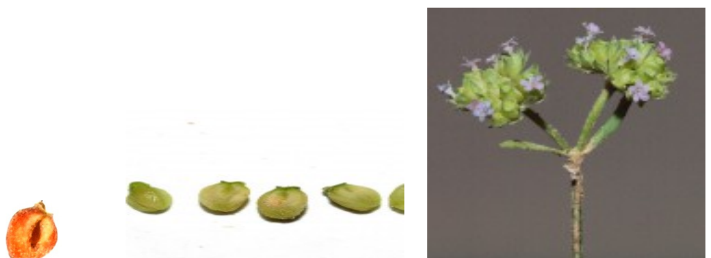
ולריינית זעירה תמונה 3 - מימין. תקריב פרחים. צילם: דרור מלמד © תמונה 4 - במרכז. תקריב פירות. בפרי הימני בצילום - חתך רוחב. צילם: דרור מלמד © תמונה 5 - משמאל. פרי בשל. צילם: דרור מלמד © להגדלה - לחצו על התמונות