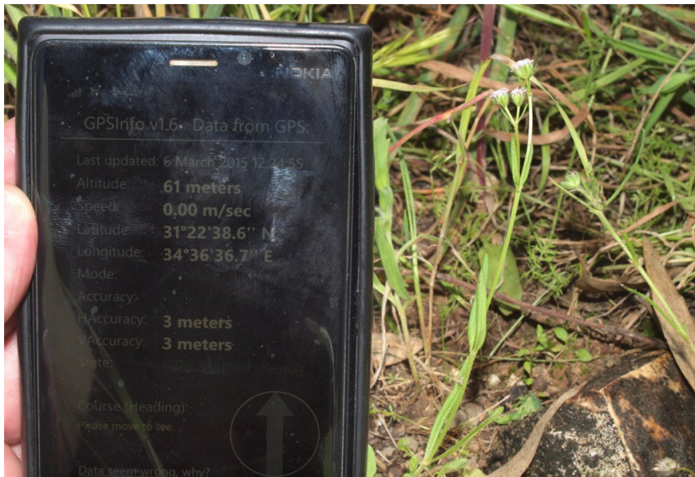
תמונה 7. ולריינית זעירה במקום האיסוף.