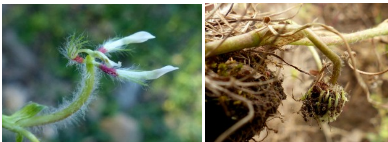
לתלתן תת-קרקעי . מימין - גיאוקרפיה, עוקץ התפרחת מחדיר את קרקפת הפירות

לתלתן תת-קרקעי שמור מקום של כבוד בהיסטוריה של חקר מטבוליטים משניים בעולם הצמחים וחיבותם להגנה הכימית של הצמחים . מה הם מטבוליטים משניים (Secondary Metabolites) ומהי משמעות ההגנה הכימית (Plant chemical defense) של הצמחים? בבתי גידול טבעיים, הצמחים מוקפים במספר עצום של אויבים אפשריים. מגוון של חיידקים, נגיפים, פטריות, נמטודות, קרדיות, חרקים, יונקים ובעלי חיים אחרים - כולם ניזונים מצמחים. הצמחים מטבעם אינם יכולים לחמוק ולהתרחק מהפתוגנים ומההרביבורים ואחד מאמצעי ההגנה שעומדים לרשות הצמחים היא הגנה כימית. הצמחים מייצרים סדרה ארוכה ומגוונת של תרכובות אורגניות שאין להן כל תפקיד ישיר בגדילה ובהתפתחות הצמח. תרכובות אלו ידועות בכינון "מטבוליטים משניים", ותפקידם הוא הענקת הגנה מגוונת לצמחים מפני אויביהם, זו המכונה "ההגנה הכימית" (פרבולוצקי ופולק, 2001; טייז וזייגר, 2003). כמה אסטרטגיות מוכרות בהגנה הכימית שמעניקים מטבוליטים משניים לצמחים כנגד הרביבורים (אוכלי צמחים, בעיקר יונקים וחרקים) כגון הפיכת המזון לבלתי אטרקטיבי (דחיית אכילה) על ידי חומרים המורידים את זמינות המזון (ליגנינים וטאנינים), כימיקלים הגורמים להרעלת ההרביבורים (אלקלואידים) ואסטרטגיות נוספות (Rosenthal & Berenbaum, 1991). כפי שלמדנו במהלך הסיור, התכונה המאפיינת את המין לתלתן תת-קרקעי (מבין מיני התלתן) היא הגיאוקרפיה - לאחר הפריחה מתארך עוקץ התפרחת והקרקפת חודרת לקרקע. בקרקע מבשיל התרמיל ובתוכו מבשילים הזרעים (זהרי, 1978).