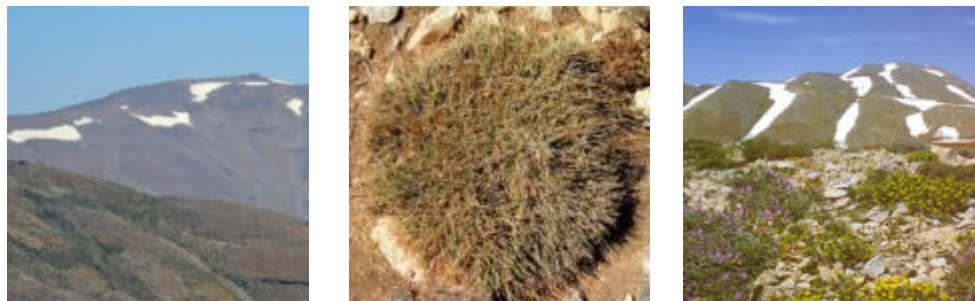
משמאל: פסגת החרמון (2804 מטר) מצולמת ממצפן שלגים. מימין: החרמון הסורי מרכז גבעות הקרב. פסי השלוגיות הממוקמות במפנים המזרחיים הטעו מזה דורות את הצופים בחרמון, אשר פרשו כי "בצד המזרחי של מצלעות החרמון יורד יותר שלג, צילם עוז גולן © במרכז: כספסף רחב-פרי, גדל בחרמון מעל 2500 מטר בפסגות מוכות רוח. צולם ברכס א-שאהרה באדום (א.ש.).

מקובל 2807 מטר). הנוף היה נהדר עם תצפית לאגן דמשק בצפון מזרח מחד, ולאגם קרעון בבקעה הלבנונית בצפון מערב מאידך.. העורב של הרים גבוהים - זג אדום-מקור התעופף מסביבנו. אינני זוכר אם באותו טיול מצאנו את המערה אשר ליד הפסגה והמקדש ההלניסטי החצוב בתוכה.