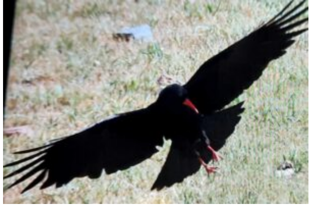
מימין: זג אדום-מקור, מין עורב החי באזורים אלפיניים ומופיע בחרמון בעיקר בחורף. משמאל: עגורים בעמק החולה על רקע החרמון המושלג.

ראינו גם מיני ציפורים אחדות שלא הכרנו מישראל. הפליאה אותי צחינית החרמון (עפרוני צבעוני עם ציצית בראשו) ושפע פרפרים ומושיות(פרת משה רבנו). לפתע נשמעה קריאה "נחש" ומיד יידו בו אבנים. אני מתקרב ומזהה צפע שאינו מוכר לי(בדיעבד- צפע החרמון , ראה תמונה). הצפע היה פצוע אבל עדיין חי והצלחתי להנציח אותו בכמה תמונות. למרות שננזפתי ע"י המפקד שאני מעכב את הטור, קברתי את הצפע בשלוגית מתחת הקרח בתקווה לאסוף אותו בדרך חזרה. ראינו גם את גמל-שלמה המדברי אותו הכרנו ממדבריות הנגב. חפשנו את העורב האלפיני ( זג אדום-מקור ) אך העלנו חרס.