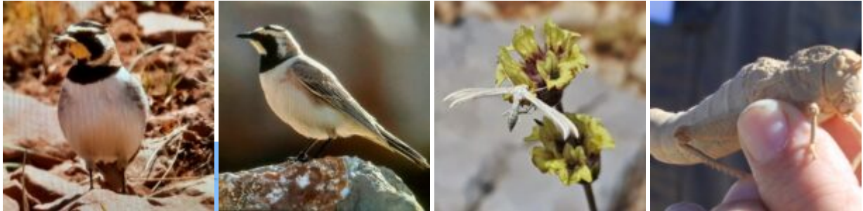
מימין: רגבן החרמון, נקבה חסרת כנפיים זהו חגב שכיח עד פסגת החרמון; מאפיין אזורים אלפיים נטיה לצמצום או ניוון כושר התעופה. שני מימין: אשנוצית החבלבל ( עש-לילה) על תפוחת ברזילון הלבנון. הזחל כנראה ניזון מעלי חבלבל הלבנון. צילם איתן שפירא © צחינית החרמון, ציפור של הרים גבוהים הדוגרת במרומי החרמון. משמאל: בהרי מרוקו, מימין: בהר החרמון, צילם דרור גלילי ©

ראינו גם מיני ציפורים אחדות שלא הכרנו מישראל. הפליאה אותי צחינית החרמון (עפרוני צבעוני עם ציצית בראשו) ושפע פרפרים ומושיות(פרת משה רבנו). לפתע נשמעה קריאה "נחש" ומיד יידו בו אבנים. אני מתקרב ומזהה צפע שאינו מוכר לי(בדיעבד- צפע החרמון , ראה תמונה). הצפע היה פצוע אבל עדיין חי והצלחתי להנציח אותו בכמה תמונות. למרות שננזפתי ע"י המפקד שאני מעכב את הטור, קברתי את הצפע בשלוגית מתחת הקרח בתקווה לאסוף אותו בדרך חזרה. ראינו גם את גמל-שלמה המדברי אותו הכרנו ממדבריות הנגב. חפשנו את העורב האלפיני ( זג אדום-מקור ) אך העלנו חרס.