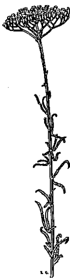
אכילאה ארם-צובאית Achillea aleppica Dc.

עוד שני צמחים נדירים שנמצאו למרגלות המצוק הם אכילאה ארם-צובאית ועלוקת סגונית (רכת שיער לפי הפלורה). אכילאה ארם-צובאית היא בן-שיח עם עלים צרים מאוד ופרחים צהובים. היא דומה ל אכילאה גפורה הידועה מהחרמון אבל אין היא מכוסה בשערות צמירות וצפופות אלא בשערות דלילה. אכילאה ארם-צובאית נמצאת גם באיזור לכיש וצפונית לעומר ויש לה תפוצה אירנו-טורנית רחבה בארצות המזרח התיכון. לעלוקת סגונית פרחים צהובים וסגולים וגם הגבעול והחפים הם סגולים. זהו מין נדיר של בחת סירה קוצנית.