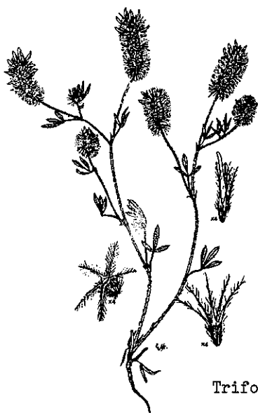
תלתן הנביאים Trifolium prophetarum Hossain