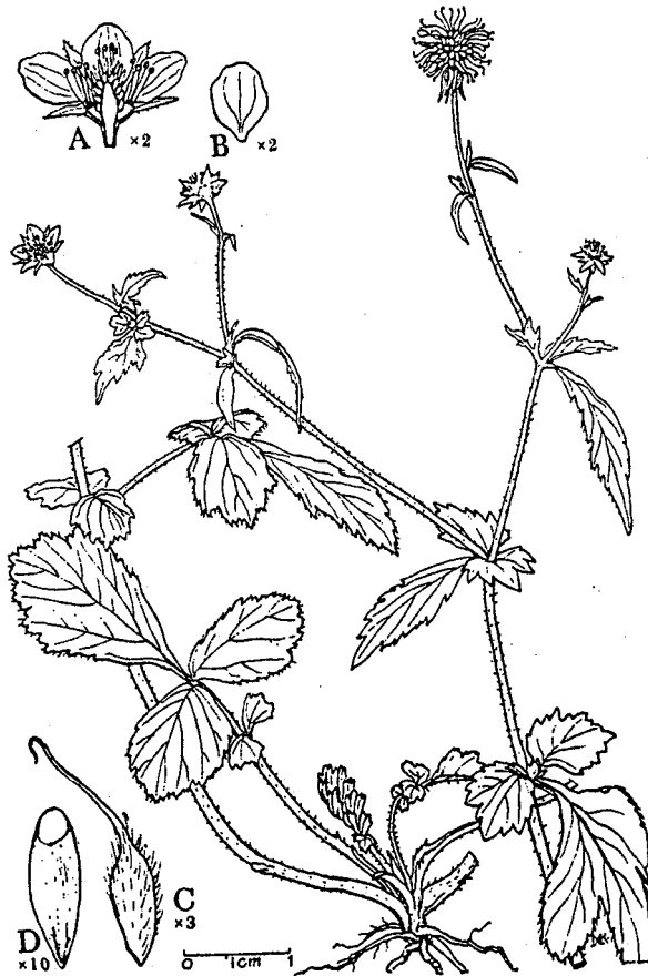
גיאון היערות Geum Urbanum L.

גיאון היערות הוא עשבוני רב-שנתי ממשפחת הורדניים, גובהו מגיע עד 60 ס"מ. הוא שופע עלים מנוצים, ולכל עלה 2 או 3 זוגות של עלעלים משוננים שאורכם 0.5-1 ס"מ ועלעל קיצוני גדול באורך 3-5 ס"מ. הגיאון נושא מספר קטן של פרחים צהובים על עוקצים ארוכים, הם דומים לפרח של תות שדה, וגודלם 5-9 מ"מ. השחלילים (המזכירים את הזרעונים של המורכבים) מרובים, וכל אחד נושא עמוד עלי אדום הבולט בקצהו. מין דומה לגיאון אשר נמצא באותו בית-גידול בחרמון הוא זנבן שונה-פירות ( Orthurus heretocarpus (Boill.) Juz.). הזנבן נבדל מהגיאון בשחלילים המעטים אך גדולים יותר ובעלי הכותרת הקטנים, אשר לא עולים על אורך עלי הגביע.