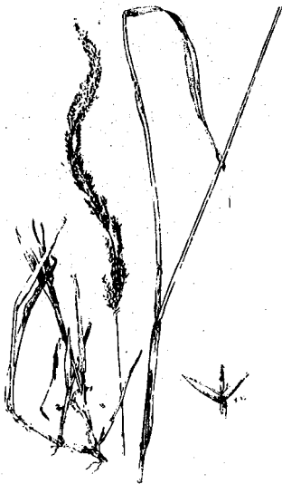
Agrostis stolonifera - נחלית השלוחות