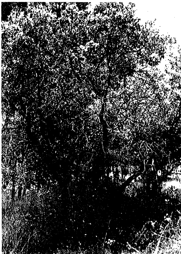
פרדס חנה : חורשת אלונני החבור.