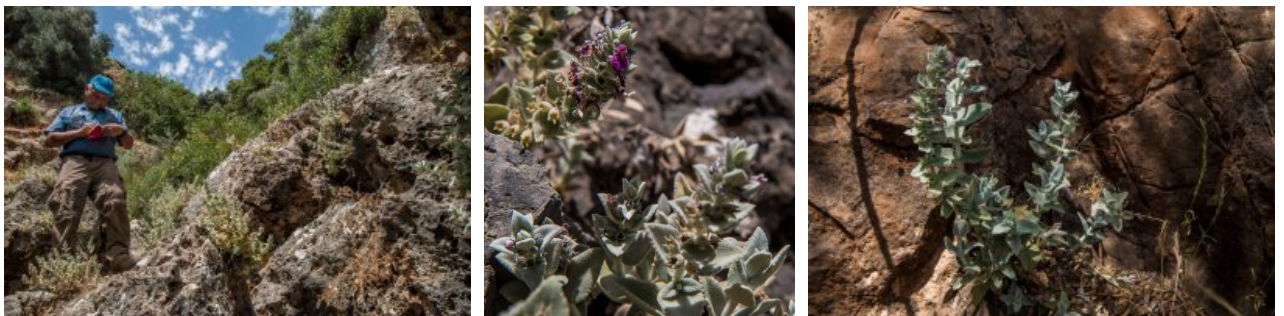
אשבל נמרוד במצוקי נחל גובתא 7.6.19. להגדלה - לחצו על התמונה.

אשבל נמרוד Stachys paneiana תואר כבר לפני 150 שנה מאזור הבניאס, והחל משנת 1990 אנו מוצאים אותו במצוק במפנה הדרומי של נחל גובתא מול קלעת נמרוד. והנה בסיור שערכנו בתאריך 7.6.2019, מצאנו את אשבל נמרוד "שולט" בכל המצוקים של המוצלעות הפונות דרומה בנחל גובתא. במקום זה אשבל נמרוד הוא צמח הסלעים השכיח ביותר. שיא פריחתו בחודש מאי, אך בכיסי קרקע לחים הפריחה ממשיכה לאורך כל הקיץ. אשבל נמרוד שייך לקבוצת " אשבל ארץ-ישראלי " לה אופיניים עלים שעירים לבידים הנותנים לצמח את צבעו הלבן. הדגם הביוגאוגרפי של מיני הקבוצה הוא אלופטרי, כאשר שלושה מינים קרובים מחלקים את המרחב הגאוגרפי במזרח הקרוב בדגם תפוצה שאיננו חופף; כלומר, בעוד כולם גדלים במצוקים, מין אחד מחליף את משנהו באזורים גאוגרפיים. כך למשל אשבל נמרוד מחליף את אשבל השלג הגדל בצפון סוריה ובטורקיה. אשבל