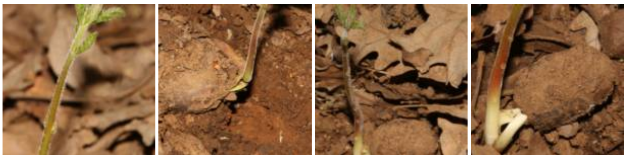
שלבי נביטה של אלון שסוע בערוץ הלח בחרמון ברום 1350 מטר, 15.5.20.

אלון שסוע Quercus cerris הוא מין נדיר ביותר בחרמון הידוע בחרמון הישראלי רק מאתר אחד בלבד - הערוץ הלח בנחל ערער תחתון ברום 1350 מטר מעל פני הים. הגדרת המין והבדלתו מאלון הלבנון קשה ומצריכה בדיקה של ספלולי הפרי, אלה הכוסיות דמויות ספל בהן נתון הבלוט של האלון. והנה לאחר 50 שנה של "שחרור החרמון" מרעיה וכריתה הרסנית השתקמו עצי האלון השסוע אשר בערוץ הלח והם מניבים עתה מאות בלוטים הנושרים על הקרקע בעונת הסתיו. רובם נאכלים בתאווה על ידי חזירי הבר, אך אחדים מהם הצליחו להיטמן ולהתחבא בתוך נשר העלים אשר מתחת לעצים. והנה לאחר ארבעים וחמש שנה בהם אנו מסיירים בחרמון ומחפשים נבטים של בלוטים, עדות להתחדשות היער ההררי בחרמון מצאנו בסוף חודש אפריל 2019 ארבעה נבטי אלון שסוע מתחת לעצים בערוץ הלח. חזרנו בחודש מאי למקום והנבטים עדיין חיים ומלבלבים. זוהי עדות ראשונה לנביטה והתחדשות של האלון השסוע בחרמון, אינדיקציה עקיפה לכך שהרס היער בחרמון הוא בעיקר תוצאה של התערבות האדם ולא גורמי סביבה אחרים.