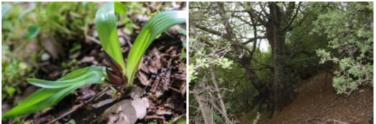
עצי אלון שסוע גדולים ומתחתם גדלה בצל סתוונית בכירה הפורחת בחודש ספטמבר. בתמונה משמאל רואים שלושה "וחצי" עלי סתוונית בכירה ובמרכז פרי בשל. צלם חנן יחיאלי ©. את התמונה מימין צילם נ.צברי ©

אשר למציאת נבטי הבלוטים של אלון שסוע בחרמון חשיבות גדולה בשמירת טבע והבנת הדינמיקה ארוכת הטווח של היער בחרמון. משנת 1967 ועד סביבות שנת 2000 לא מצאנו בכלל נבטים של אלונים נשירים ביער ההררי בחרמון. אחרי שנת 2000 התחלנו למצוא באופן נדיר ביותר בלוטים של אלון תולע על גבי עצים אשר התפתחו יפה וגובהם עלה על חמישה מטר. בדומה לכך התחלנו למצוא לאחר שנת 2010 גם בלוטים של אלון הלבנון במעונות מוסתרים מרוח בעלי קרקע עמוקה ועשירה. והינה זו הפעם הראשונה שאנו מדווחים על נביטת אלון שסוע בחרמון; זוהי הנקודה הדרומית ביותר במזרח-התיכון בו גדל אלון שסוע ושמח לראות כי כתם יער צפוני זה מתחדש מבלוטים באופן טבעי.