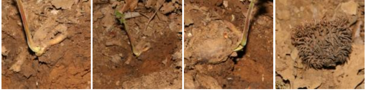
שלבי נביטה של אלון שסוע בערוץ הלח בחרמון ברום 1350 מטר, 15.5.20. מימין ספלול של אלון שסוע משנת 2018 ששרד בנשר מתחת ליער אלון שסוע.

אשר למציאת נבטי הבלוטים של אלון שסוע בחרמון חשיבות גדולה בשמירת טבע והבנת הדינמיקה ארוכת הטווח של היער בחרמון. משנת 1967 ועד סביבות שנת 2000 לא מצאנו בכלל נבטים של אלונים נשירים ביער ההררי בחרמון. אחרי שנת 2000 התחלנו למצוא באופן נדיר ביותר בלוטים של אלון תולע על גבי עצים אשר התפתחו יפה וגובהם עלה על חמישה מטר. בדומה לכך התחלנו למצוא לאחר שנת 2010 גם בלוטים של אלון הלבנון במעונות מוסתרים מרוח בעלי קרקע עמוקה ועשירה. והינה זו הפעם הראשונה שאנו מדווחים על נביטת אלון שסוע בחרמון; זוהי הנקודה הדרומית ביותר במזרח-התיכון בו גדל אלון שסוע ושמח לראות כי כתם יער צפוני זה מתחדש מבלוטים באופן טבעי.