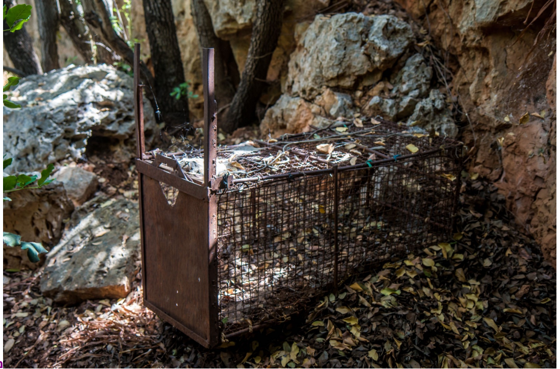
מלכודת דורבן אשר

שוכנת למרגלות המצוק הענק (מצוק האשבל) במצלעות הצפוניות של נחל גובתא. להגדלה - לחצו על התמונה.