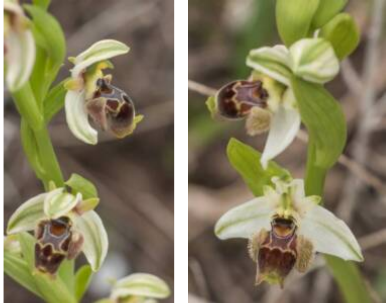
דבורנית בארי 7.2.18 Ophrys umbilicata ssp. beerii גברעם, צילם א.שפירא ©

דבורנית בארי Ophrys umbilicata subsp. beerii Shifman שייכת לקבוצת "דבורנית אומביליקטה - umbilicata " אשר המינים הגדלים ממנה בישראל הם דבורנית דינסמור, ד.רודוס, ד.בארי וד.רחבת-שפה (= ד.צהובת-שוליים). אופייני לקבוצה הוא שהעלה העטיפי החיצוני האמצעי קמור ונוטה קדימה וחופן באופן חלקי את אברי המין של הפרח; השם של הקבוצה Umbilicata ניתן על שם דבורנית אומביליקטה (דבורנית הטבור) אשר נפוצה בקפריסין, האיים האגאיים, וטורקיה. באשר לישראל, מקובלת היום הדעה שדבורנית דינסמור, ששמה המדעי Ophrys carmeli , היא שם נרדף בלבד לדבורנית הטבור ואינה מין נפרד. (במשפט מוסגר אציין שדעה זו לא מקובלת עלי ואני עוסק בימים אלו בהשוואה של הנתונים המורפולוגיים, נתוני המאביקים וגם השוואה של נתונים גנטיים בין הדינסמור בישראל והאומביליקטה מקפריסין במטרה להוכיח שדבורנית דינסמור היא מין או לפחות תת מין עצמאי ולא שם נרדף לאומביליקטה).