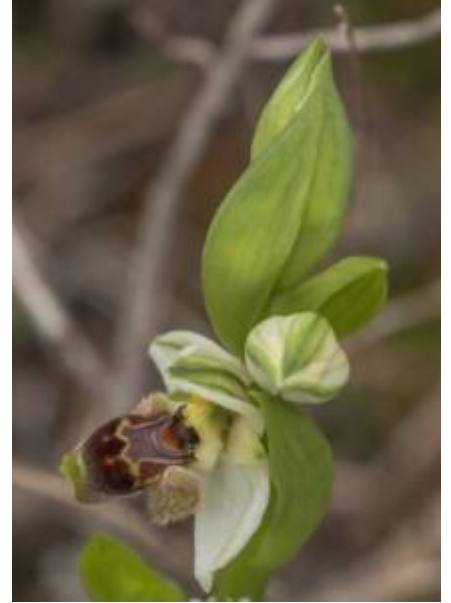
דבורנית בארי 7.2.18 Ophrys umbilicata ssp. beerii גברעם

כדי להקל על זכירת ההבדלים בין דבורניות קבוצת הטבור (אומביליקטה), חיברתי סימנים בחרוזים לנוחיות הקוראים: