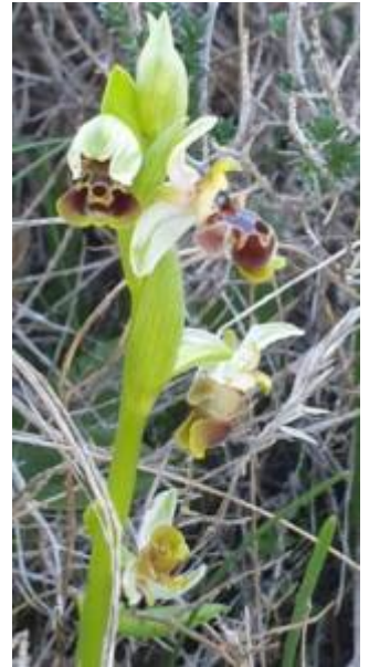
דבורנית בארי 6.2.20 Ophrys umbilicata ssp. beerii תל-רעים

מכיוון שעל הפרק דבורנית בארי נתרכז הפעם במאפיינים שלה ובהבדלים בינה ובין הדבורניות האחרות בקבוצה. כדי לא לייגע נציין מעכשיו את שם המין בלבד ללא שם הסוג.