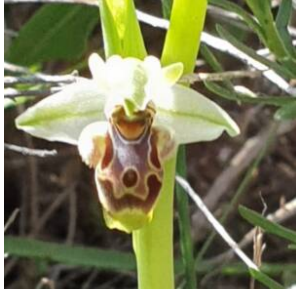
דבורנית דינסמור Ophrys carmeli מאוכלוסיית שוקדה, השתלמות כלנית 6.2.2020, הגדיר אסף שיפמן ; נדגיש כי פרטים אלה צולמו בתוך אוכלוסיה גדולה אשר הוגדרה כדבורנית בארי Ophrys umbilicata ssp. beerii .