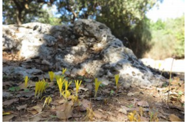
תמונות 4.3. חלמונית זעירה בגבעת עדה. 22.10.2014.