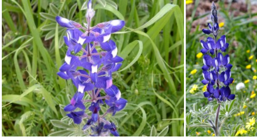
תורמוס ההרים: שינוי צבע של הפסים בגב מפרש. הצבע הפסים בפרחים התחתונים השתנה מלבן לוורוד כהה לאחר ביקור מאביקים.

לתורמוס ההרים תרמילים ארוכים ורחבים. אורכם 4 עד 7 ס"מ ורוחבם כ-15 מ"מ. התרמילים שעירים מאוד ותפוחים מהזרעים הגדולים. הזרעים דמויי עדשה וקוטרם כ-13 מ"מ. זרעי התורמוס מרים ומכילים חומר רעיל בשם "לופולין".