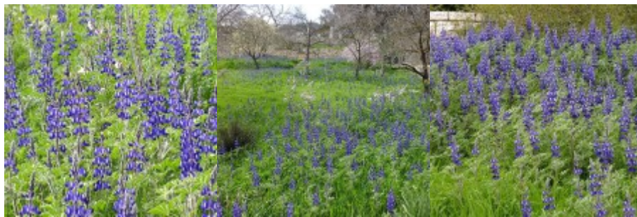
מרבדי פריחה של תורמוס ההרים.

בשוליים המערביים של הגולן - מצפה אופיר, שמורת גמלא ונחל חמדל אוכלוסיית הגולן גולשת עד לעמק החולה לאזור שולי כביש גדות גונן בגן הבוטני האוניברסיטאי בגבעת רם - מרבדים גדולים בחלקת אסיה וחלקת הים התיכון