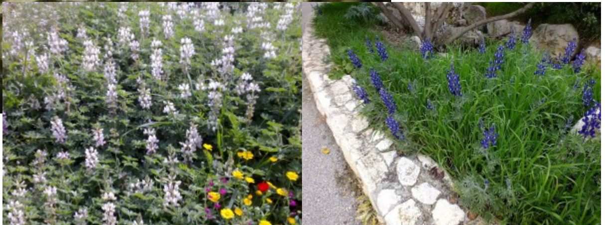
מימין - תורמוס ההרים בגינות. משמאל - תורמוס ארץ-ישראלי, מין קרוב לתורמוס ההרים.

באוכלוסיות גדולות של תורמוס ההרים ניתן להבחין בפרטים בעלי מוטציה שבה צבע הפרחים ורוד או לבן במקום כחול.