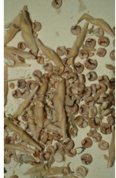
תורמוס ההרים. מימין - זרעים; משמאל - תרמילים.

תורמוס ההרים גדל בטבע החל מרום של 100 מטר ולא גדל בר במישור החוף. הוא נפוץ בגולן בגליל ובכרמל, נדיר יותר בשומרון, יהודה ובשפלה. בשנים האחרונות הוא נזרע