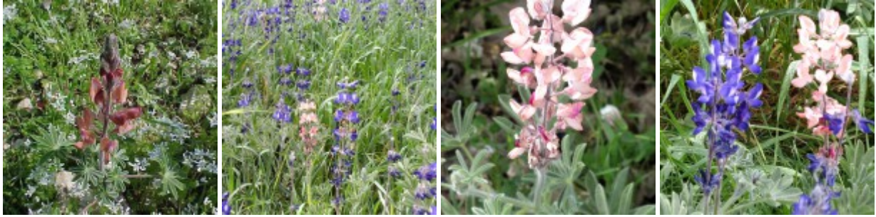
צורות לבנות וורודות של תורמוס ההרים. ראשון, שני ושלישי מימין משמאל

אוכלוסיות גדולות ובולטות של תורמוס ההרים ניתן לראות במקומות הבאים: רמות מנשה - כביש 70 בין מחלף בת שלמה ליוקנעם, בעיקר מצפון לכביש גליל תחתון - צומת גזית, נחל תבור, כפר תבור ונעורה שפלה - תל שוכה