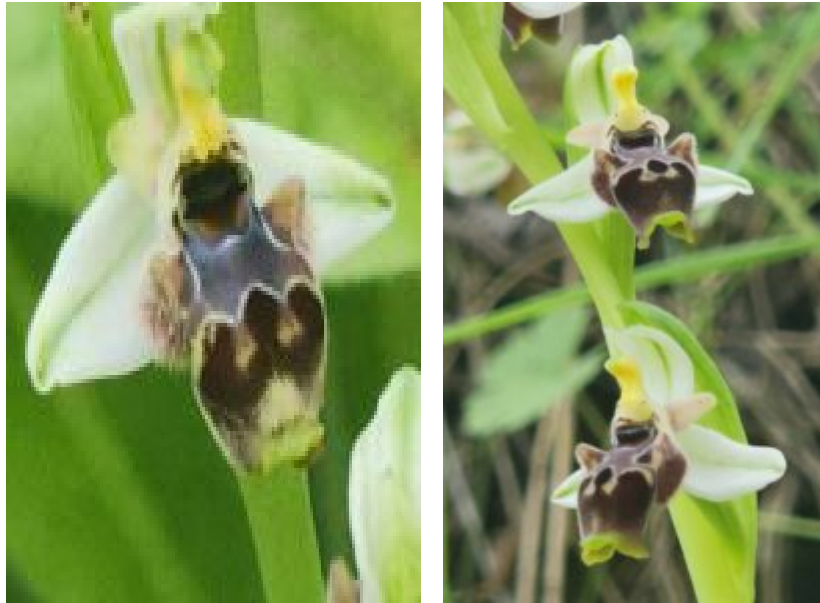
דבורנית בארי כפי שהוגדרת על ידי אסף שיפמן, גבעת תום ותומר ליד נגבה. פרטים אלה מהווים צורת ביניים בין דבורנית בארי לד.דינסמור(לפי דעתו של א.ש.)