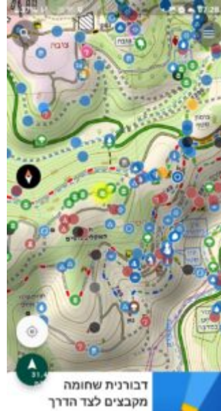
מימין: מפת עמוד-ענן המורה את הדרך לאתר דבורנית שחומה בהר-איתן (מסומן בכתם צהוב זוהר). משמאל: דבורנית שחומה פורחת בהר-איתן בהרי ירושלים

איך מגיעים - לבאים מכביש אחד מכיוון תל-אביב (או בכביש 6 המתחלף לכביש אחד) נוסעים מזרחה לכיוון ירושלים, עד צומת מבשרת ציון ופונים ימינה (דרומה) בכביש מספר XX לכיוון הסטף והר איתן. בצומת איתן פונים לפי השילוט להר איתן ומחנים בחניית האספלט הגדולה (כ-500 מטר מהצומת). מהחניה יש ללכת מערבה לתחילת שביל סובב הר-איתן. זאת דרך עפר רחבה באורך של כ-8 ק"מ הסובבת את הר איתן בצורה אליפטית. בערך כ-600 מטר מתחילת דרך סובב הר-איתן, גדלות אוכלוסיות של דבורנית שחומה בשוליים. פרטים בודדים פורחים עתה בשיאם בכל אזורי הבתה הקרטוניים (גיר רך-לבן) בהר איתן ובהרי ירושלים. הנחיה למיקום האתר (לחץ כאן) בוויז: