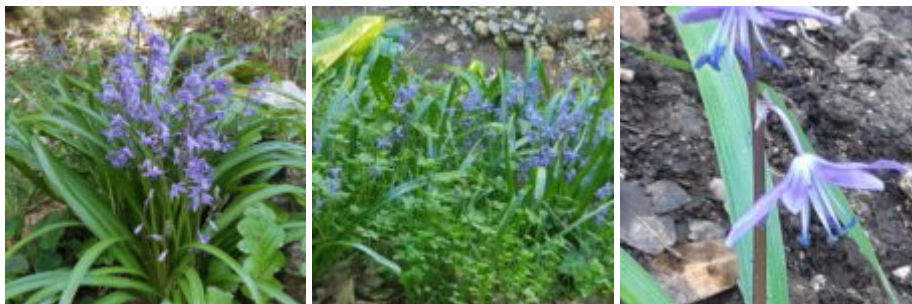
בן-חצב החורש, עין-אלון כרמל, 8.2.25

פרחי משפחת האספרגיים (שושניים) הגדלים בארצנו, מצטיינים בבצל תת-קרקעי ובפרחים גדולים וצבעוניים. נוכל להבחין במשפחה זו במבנה הפרח בשתי קבוצות: סוגים בעלי עלי כותרת מאוחים היוצרים עטיף דמוי כד או צינור כגון זמזומית, כדן או מצילות - לבין סוגים בעלי עלי כותרת מפורדים היוצרים פרח דמוי כוכב הפתוח לרווחה דוגמת שום, נצ- החלב, זהבית, צבעוני וחצב. בן-חצב החורש נמנה על קבוצת הפרחים הפתוחים. אך לעומת חבריו, בן-חצב סתונוי וב.ח. מדברי יש לו פרח גדול ומרהיב עין בצבעו הכחלחל. מין זה נדיר למדי בגליל ותפוצתו בלבאנט דרומה מסתיימת באתר זה - עין אלון.