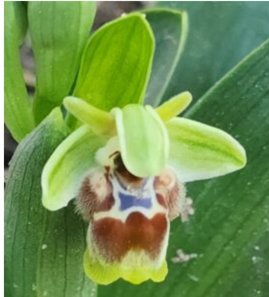
מימין: דבורנית בארי, שמורת בארי, 6.2.25

שימו לב לשולי השפית הירקרקים בשולי השפית, תכונה עיקרית המבדילה אותה מדבורנית דינסמור, צילפ שמעון כהן © משמאל: מפת עמוד-ענן המורה את הדרך לאתר דבורנית שחומה בהר-איתן (מסומן בכתם צהוב זוהר).