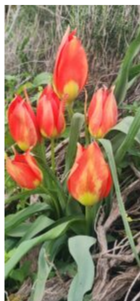
מימין- צבעוני ההרים, מעגן מיכאל משמאל מפת הגעה לאתר במעגן מיכאל

איך מגיעים - נוסעים על כביש 4 לכיוון קיבוץ מעגל מיכאל ופונים במחלף מעגן מיכאל מערבה. נוסעים עם הכביש ועוברים בגשר מעל לכביש 2, עוברים את שער הקיבוץ לאחר הכר פונים חצי פניה ימינה ועוברים סככות של רפת. מיד לאחר הסככות, פונים ימינה, צפונה. אפשר להמשיך עד לבית העלמין, לפניו פונים ימינה (מזרחה) וחונים בסוף מגרש החניה. נכנסים אל השבילים בתוך צמחי האלת המסטיק, הגעתם, מוזמנים לקסם. ניתן להמשיך ולנסוע עוד צפונה על למחסום בין בריכות הדגים של מעגן מיכאל - מעיין צבי ואחריו שוב גבעות כורכר מלאות בצבעונים וצומח גבעות הכורכר.