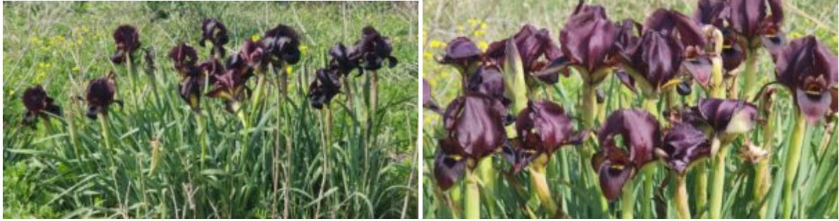
איריס הארגמן בתל סחר, המקום הצפוני ביותר בו הוא גדל בעולם (אוכלוסיה מושבת).

איך מגיעים - (תל זומרה) מכביש 6, נרד במחלף קיסריה לכביש 65 בכיוון חדרה. נחלוף על צומת נחל חדרה ונתקדם עוד כ-750 מטר. נחלוף ע"פ תחנת דלק ומצד ימין מצד שמאל (צפון), מעט אחריה יש דרך עפר, משמאלינו - נרד אליה ומיד נמשיך בדרך עפר מקבילה לכביש כ-700 מטר. בפניה הראשונה נפנה ימינה (דרומה) מימולנו, כ-400 מטר - תל זומרה. תל סחר-מגדים : מכביש 4, בכיוון מת"א לחיפה, נחלוף על צומת אורן. לאחר כ-1.5 ק"מ, נפנה מערבה (שמאלה) אל מושב מגדים. בצומת הראשית - 400 מטר נפנה שמאלה (דרומה) 800 מטר ואז נפנה שוב מערבה, עד לסוף הכביש, ואם נצליח נתקרב עפ הרכב (או ברגל) אל מסילת הברזל. נעבור במעביר מים מתחת למסילה, מערב למסילה , ויתגלו לנו מקבצי אירוס הארגמן הצפוניים בעולם.