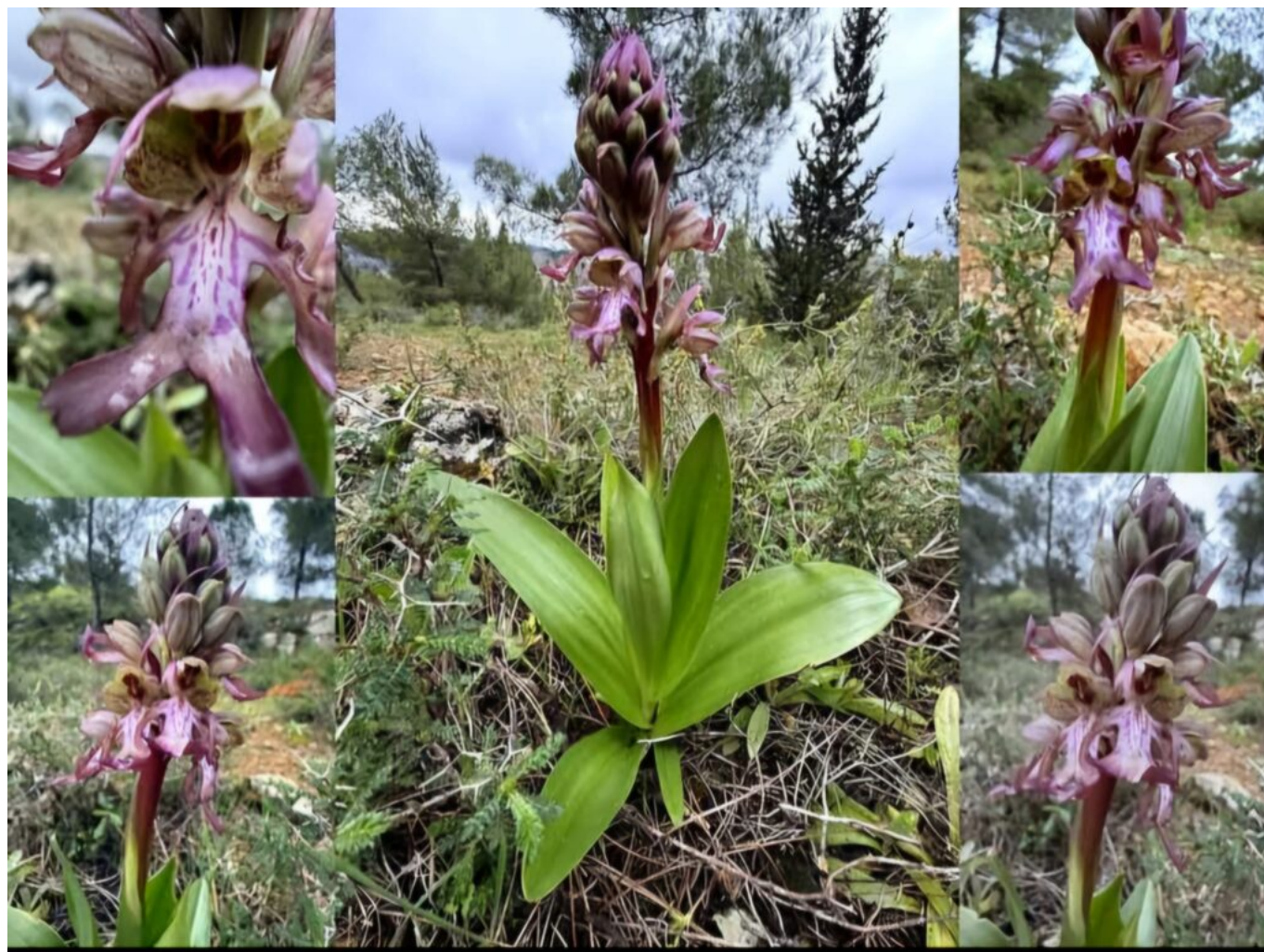
רצועית רוברט, הר אחירם מבשרת ציון 22.2.2025

איך מגיעים - ניסע מכביש 1 לירושלים ונפנה שמאלה (צפונה) במחלף הראל אל מבשרת-ציון. ניסע לרחוב חרמון 36. [דרך רח' הראל, נפנה ימינה לרח' יצחק ניסים, בככר הראשונה ימינה לרחוב חרמון ושם נחנה באזור בבית מס' 36 (שני דקלים בגינה)]. במאמץ קל והרבה זהירות נעבור את הגדר, ונרד שתי טרסות. נפתח עיניים ושם, אם יתמזל מזלנו, נראה את רצועית רוברט מוקפת בעיגול של אבנים. לא להתיימש, חפשו ותמצאו. תוכלו להתבשם משפעת הפריחה במקום, דבורנית שחומה, דבורנית דינסמור, סחלב הגליל ועוד.