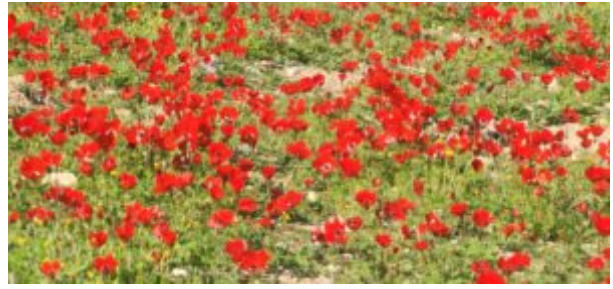
מרבדי כלנית מצויה זן אדום ביער שחריה - בחורבת פתורה, 16.2.2025