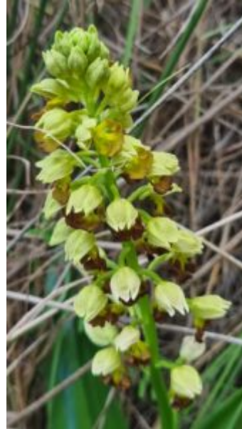
סחלב נקוד, עין אלון