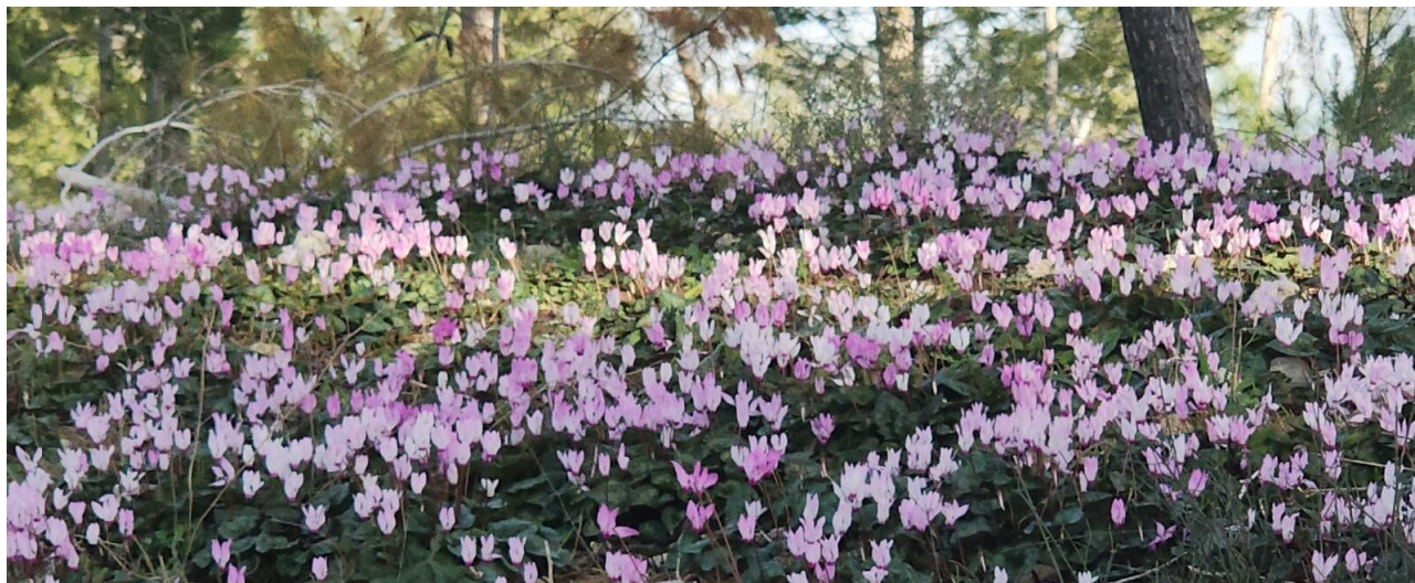
מרבדי רקפת מצויה ביער המלאכים ובחורבת פתורה, 16.2.2025