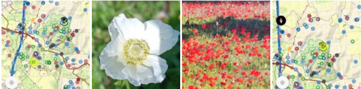
מפת התמצאות של אתר הכלניות והרקפות ביער המלאכים (מימין) ובחורבת פתורה - יער שחריה (משמאל), האתר זוהר בצהוב. במרכז מרבדי כלניות אדומות וכלנית אחת בצבע לבן, כנראה מוטציה אשר בה מסלול יצירת הפיגמנט האדום פגומה ( וגם השחור, ראה צבע האבקנים והעללים), צילם שמעון כהן ©

ושכחנו להמליץ על הרקפת המצויה ביער המלאכים, אשר הפכה לאחד מסמלי הטבע האהובים; פקעות ופרחים שלה התפשטו ב-50 השנה האחרונות ביערות קק"ל במיוחד באזורים מוצלים. בעוד בית גידולה הראשוני של הרקפת הם חגבי הסלע, התפשטה הרקפת וכבשה בית גידול נוסף אשר שמה הצמחים הים-תיכוניים הרגילים מדירים מקומם; בשל הצל וחומציות המחטים של האורן, נמנעים הצמחים החד-שנתיים לגדול כאן.