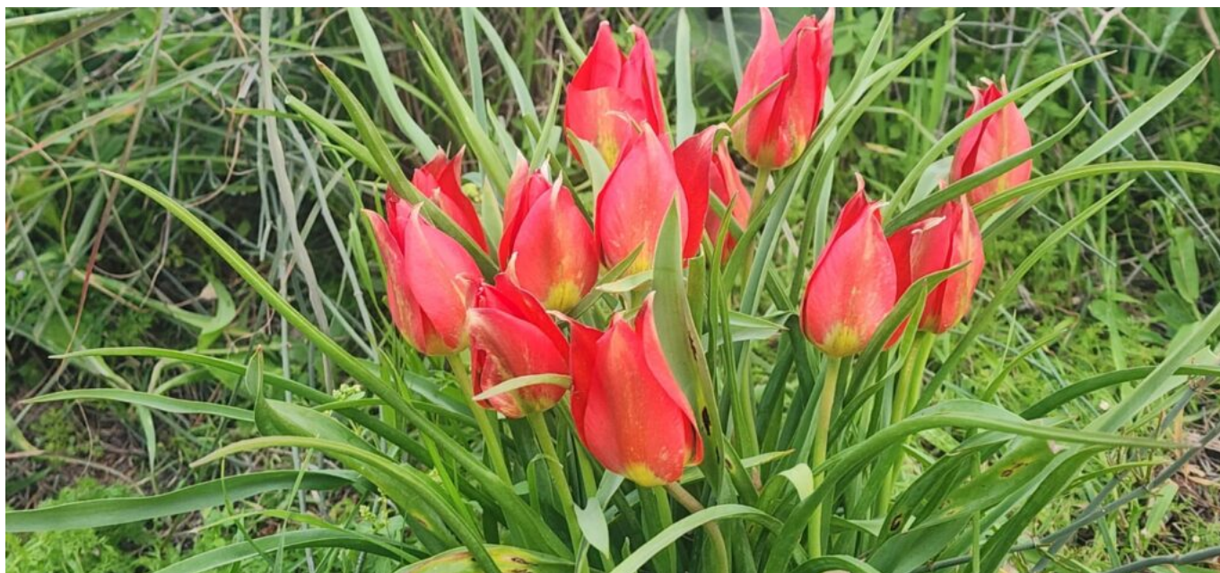
צבעוני ההרים במעגן מיכאל