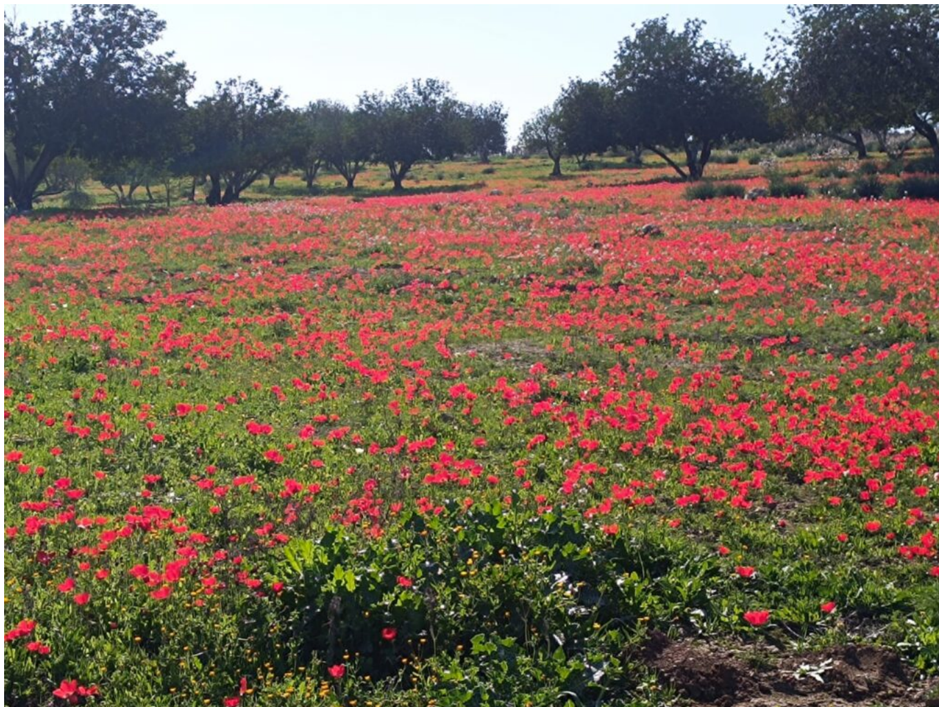
מרבדי כלנית מצויה זן אדום ביער המלאכים ובחורבת פתורה, 16.2.2025

איך מגיעים - ליער שחריה, חורבת פתורה: מכביש 6 דרומה נרד במחלף קריית גת מזרחה אל כביש 35. לאחר כ-1 ק"מ נפנה ימינה לדרך עפר, משם, ע"פ יכולת עבירות הרכב והנהג, נוכל לנסוע בדרכים שונות ביער אל כיוון חורבת פתורה, (לא חייבים להגיע עד אליה שכן כל הדרך יש כלניות רבות, למשל בחורשת החרובים).