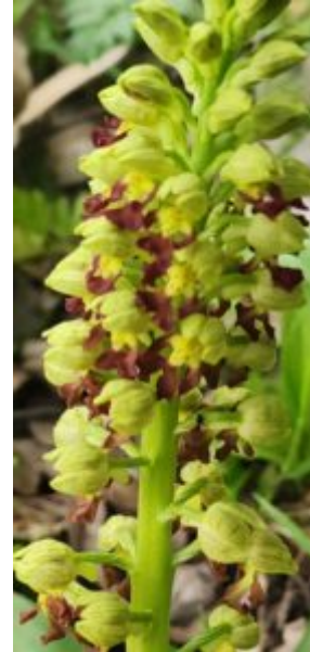
סחלב נקוד