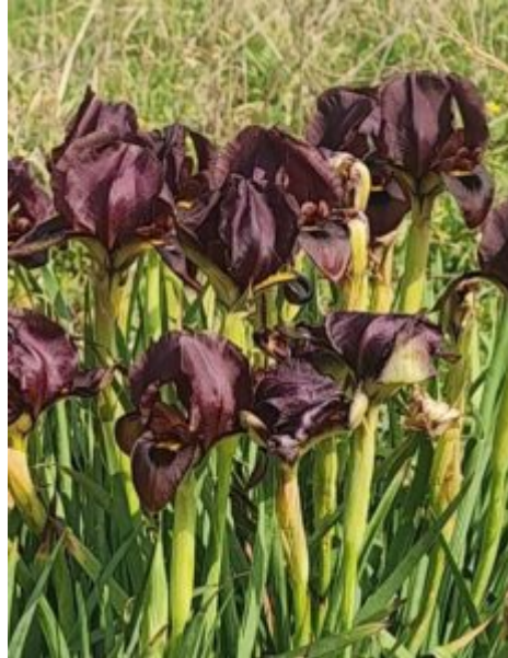
איריס הארגמן בתל סחר, המקום הצפוני ביותר בו הוא גדל בעולם. משמאל - מפת התמצאות לתל סחר ותל זומר