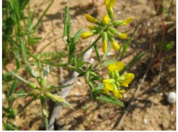
גרגרנית גלילנית.

מימין - מראה הצמח בעת הפריחה: התפרחות צפופות, הפרחים פרושים אופקי.