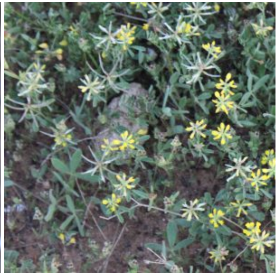
גרגרנית גלילנית.

מימין - פריחה ופירות; משמאל - תרמילים גליליים ורשתיים בעלי שערות הדוקות ומכסיפות