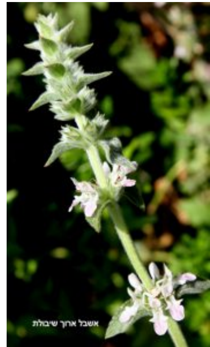
מימין: אשבל ארוך שיבולת. משמאל אשבל זוהרי. להגדלה - לחצו על התמונה.