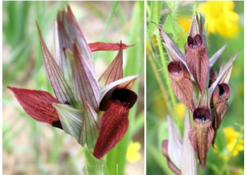
שפתן מצוי. מימין - פרחים בוגרים וצעירים בתפרחת; במרכז - השפית ושאר אונות הכותרת; משמאל - פרח ובו מובלט לוע הכותרת להגדלה - לחצו על התמונות

גודל פרח כ-2 ס"מ ולו 6 עלי עטיף שאינם אחידים בצורתם ובצבעם, מסודרים בשני דורים. שלושה עלים של הדור החיצוני בהירים ובעלי עורקי אורך חומים כהים, דקים. בסיסם רחב והקצה מחודד. העלים צפופים, אינם שווים באורכם, 2 עלים של הדור הפנימי דומים להם אך קטנים. יוצרים הגנה על אברי המין בדמות קסדה. העלה האמצעי הבולט בפרח שיצר את השפית, מחולק לרוחבו ע"י שני שני. החלק האחורי בנוי שתי אונות זקופות, מעוגלות. החלק הקדמי מוארך לצורת לשון ארוכה המשתרבת מטה ואחורנית, צבע העלה האמצעי סגול-בורדו כהה בעל עורקים כהים, ועל שטח פניו שערות בולטות. השפית משמשת עמדת נחיתה לחרקים המבקרים בפרח. אברי הרבייה מוסתרים. בפרח אבקן אחד אשר צורתו שונה מהרגיל: המאבק שלו הקבוע בלוע, התפתח לשתי לשכות נפרדות הקרויות אבקיות, בהן מלוכדים גרגירי האבקה לגוש. כל אבקית נישאת על זנבון שבבסיסו בלוטה דביקה. השחלה תחתית, הצלקת דביקה וקעורה ונמצאת מתחת למאבק.