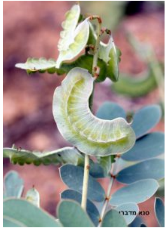
סנא מדברי. מימין - תרמיל צעיר ובמרכז מונחים הזרעים; משמאל - תרמילים בוגרים

סנא מדברי גדל בארץ במדבריות חמים. באזור ים-המלח, בעמק הערבה ובסביבות אילת. תפוצתו העולמית היא אפריקה הטרופית והאזורים הסובטרופיים מגובה פני הים עד 1850 מ'. מצוי בערב, עירק, אירן, והיבשת ההודית. בית הגידול הוא ערוצים ובתי גידול מופרעים, על קרקע חולית חרסיתית מנוקזת, בקרינה מלאה.