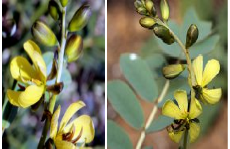
סנא מדברי. מימין - עלה מנוצה ותפרחת; במרכז - תפרחת; משמאל - פרחים בתפרחת בגיל שונה. להגדלה - לחצו על התמונות

מספר האבקנים 10, ערוכים ב-3 גבהים מעל השחלה. 3 האבקנים העליונים קצרים, צהובים חיוורים, בעלי מאבק מפותל. אבקנים אלה מנוונים. במרכז ישנם 4 אבקנים קצרים: הזיר קצר ומעובה והמאבקים ארוכים ורחבים, אלה צמודים לשחלה, ופוריים. 3 אבקנים (שנים ארוכים והאמצעי קצר) שאורכם כמחצית מאורכה של השחלה, ובעלי מאבק מוארך וקעור, נמצאים מתחת לעמוד העלי. השחלה עילית, עמוד העלי מוארך, קשתי. הצלקת קצרה מעוגלת. עם התבגרותה, נוטה עמוד העלי לעבר האבקנים והצלקת מתכופפת.