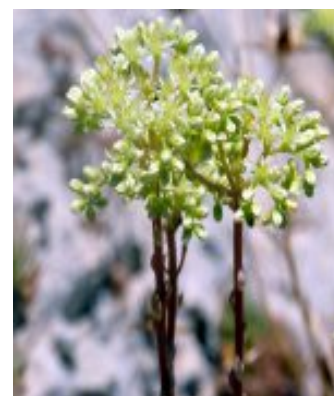
עמודי תפוחית של צורית גבוהה. להגדלה - לחצו על התמונה.

הצמח מתרבה באמצעות זרעים אך מתרבה בקלות רבה באמצעות ריבוי וגטטיבי. ענף שנשבר ומונח על פני הקרקע יצמח שורשים מגבעולו. בטבע במקום גידולו על סלעים, אם חלקי הצמח נפלו או הגיעו לחריץ בסלע הם יפתחו שורש ויקלטו במקום. צורית גבוהה מטופחת כצמח תרבות. היא מתאימה לגידול במסלעה או כצמח שתול בעציץ הגדל בקרינה מלאה או בחצי צל אשר מסתפק במעט השקיה.