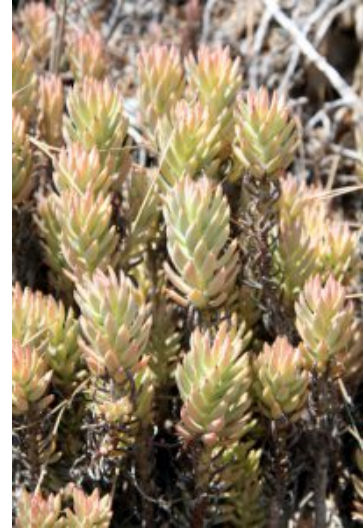
צורית גבוהה ענפים ועלים. העלים סוקולנטיים מחודדים בראשם. תמונות ערגה אלוני © להגדלה - לחצו על התמונה.

העלים תמימים אוגרי מים, יושבים על הגבעול. מסורגים או דוריים. צבעם ירוק עד חום. אורך העלה כ- 2.5 ס"מ, רוחבו 0.5 ס"מ, קמור בגבו ומעט קעור בחזיתו. רוחבו משתנה: בסיסו רחב והוא הולך ונעשה צר בראשו המסתיים בזיף מחודד שאינו דוקרני. לעלים קוטיקולה (שכבה חיצונית) עבה וחלקה השומרת על העלה. העלים הבשרניים אוגרים ברקמותיהם מים המשמשים את הצמח בעונה היבשה. תכונה נוספת ליכולת הצמח לשרוד במקומות קשים לגידול כמו על סלעים, היא יכולת ההטמעה היעיל במסלול הקרוי CAM, (בו משתמשים כ-7 אחוז מכלל הצמחים). בצורת הטמעה זו קליטת הפחמן בעלים נעשית במהלך הלילה, כאשר הטמפה נמוכה ואידוי המים מגוף הצמח מועט. הפחמן הדו-חמצני שנקלט לתוך העלה מתחבר לחומצות אורגניות, וביום הוא משוחרר, נקלט מחדש ומחוזר במעגל קלווין באמצעות אנרגיית האור. במסלול הטמעה כזה הצמחים מאבדים מעט מים כי הפיוניות סגורות ביום ולא קולטות אז פחמן דו חמצני ומים אינם מתאדים בתהליך הדיות מהצמח לסביבתו.