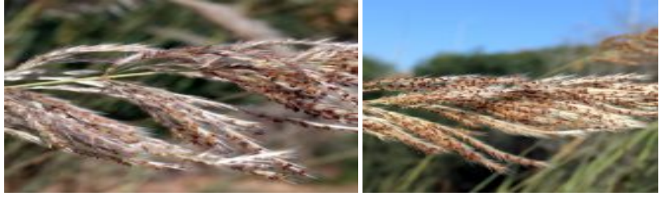
קנה-סוכר מצרי - מכבדים בשיא הפריחה. בתמונה משמאל נראים אבקנים, צלקות והשערות הצמודות לשיבוליות להגדלה - לחצו על התמונות

בארץ הצמח גדל בבת-גידול לחים, בעיקר במישור החוף על קרקעות חול-חמרה עם מי תהום גבוהים או בשולי ביצות במישור החוף גם קרוב לים. אוכלוסייה לא גדולה קיימת בגולן ולאורך בקעת הירדן. הצמח חזק, עמיד למחלות, גדל בתחום pH אופטימלי (5-6), אך הצמח מחזיק מעמד גם ב-pH בטווח של 4.5-7.5. הצמח סביל למליחות והוא מתאושש מהר אחרי שריפה. בדרום-מזרח אסיה, הוא גדל באזורים עם כמות רבה של גשמים על קרקעות קלות וחוליות, אך גם באזורים פחות גשומים. בהודו מדווח שהצמח חודר למטעי תה ושדות כותנה.