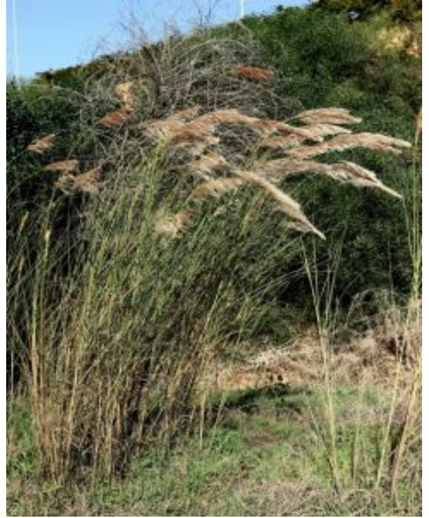
קנה-סוכר מצרי - מראה כללי של הצמח בבית גידולו. מימין - מכבדים מתבדרים ברוח; משמאל - צמחים על אדמה כבדה צמוד לתעלת מים בפולג להגדלה - לחצו על התמונות

בראש הקנה נישאת תפרחת שהיא מכבד כסוף באורך 50-60 ס"מ. המכבד מורכב מאשכולות רבים וארוכים המסודרים על הציר בקבוצות. האשכולות מתפרקים לאחר ההבשלה. בבסיס השיבוליות מצויות שערות משי רכות וארוכות פי שנים מאורך השיבולית. הן חסרות מלענים ובעלות שתי גלומות, ערוכות על האשכול בזוגות, אחת ישבת והשנייה נישאת על עוקץ קצר. לכל שיבולית שני פרחים אחד מסוג השני דו מיני. קנה-סוכר מצרי פורח מאוגוסט עד ינואר. הפרחים מואבקי רוח. במשבי רוח קלה מתבדר המכבד והאשכולות נוטים לצד אחד כששערות משי הכסופות בוחקות ופניהן בולטים האבקנים. לאחר החניטה והבשלת הפרי, הגרגר ניתק ונפוץ כשהוא באמצעות צעת שער דקה המחוברת לפרי.