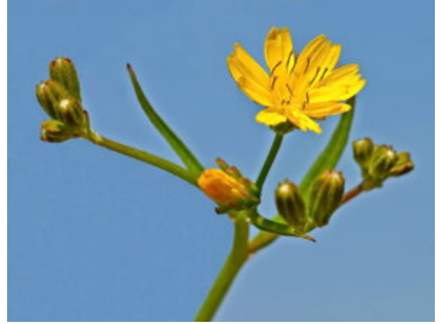
כוכבן מצוי: מימין ומשמאל, ענף נושא בקצהו מספר תפרחות בנות פרחים לשוניים. צילם ליאור אלמגור ©. באמצע, צדודית התפרחת. צילם נועם עביצל המקור "צמח השדה" ©

הפירות הנוצרים הם זרעונים בעלי שתי צורות (דימורפיים), חסרי ציצית. הזרעונים בהיקף (מ-5 עד 8) גליליים מוארכים מחוספסים ומקומטים אורכם 1-2 ס"מ, אינם נושרים בהבשלתם ונשארים על הצמח עד העונה הבאה (שמידע 2005). הזרעונים הפנימיים (1-3), קצרים גליליים ומקומטים, כפופים כסהר אל המרכז. לאחר ההבשלה הם ניתקים ונופלים אל הקרקע ונאספים ע"י נמלים וחרקים אחרים. אפשרות הפצה נוספת (זואוכוריה) היא באמצעות היצמדות הזרעונים לגופם של בע"ח החולפים במקום מה שמאפשר להם לפוץ למרחק.