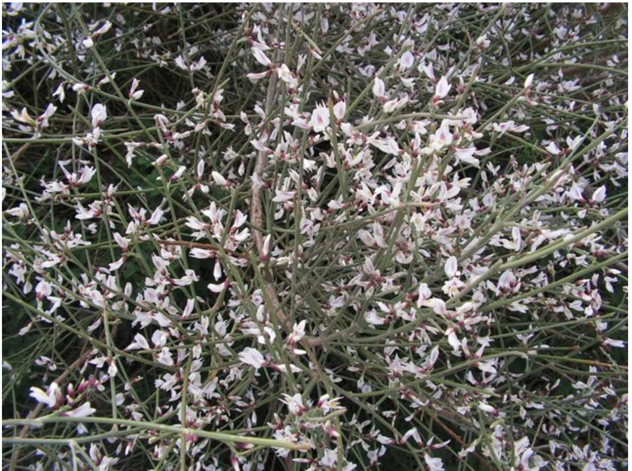
רתם המדבר - מראה כללי בעת שיא הפריחה.

רתם המדבר Retama raetam הינו שיח ממשפחת הקטניות (פרפרניים) הפורח בעיקר במדבריות ארצנו, בחגורת הספר ובמישור החוף. גובהו נע בין חצי מטר ל 4 מטר, כאשר בדרך כלל גובהו בין 1.5 ל 2.5 מטר. ענפי הרתם ירוקים וגמישים ובעלי חריצי אורך בהם יושבות הפיוניות. הימצאות הפיוניות בחריצי הגבעולים מאפשרים לצמח להמשיך ולבצע הטמעה בתקופות היובש ובעיקר בקיץ בלי לאבד הרבה מים. צבע הענפים הצעירים מכסיף ואילו הענפים הבוגרים בצבע ירוק כהה.