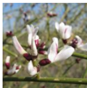
רתם המדבר.

לפי הסדר מימין לשמאל: 1. הגביע דו שפתני וצבעו סגול; 2. הכותרת פרפרנית לבנה ועל המפרש עורקים סגולים; 3. אשכולות הפריחה מפוזרים לאורך ענפי הצמח; 4. הענפים הצעירים ירוקים מכסיפים בעלי חריצי אורך עמוקים. זירי האבקנים לבנים מאוחים לצינור, צבע המאבקים קרם עד צהוב