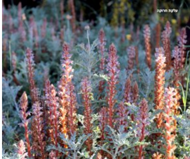
מימין: ארקטוטיס נגוע בעלית חרוקה. משמאל צמח בפריחה.

הפקעת מתעבה ושולחת מהקרקע גבעול זקוף (20-60 ס"מ), גילי ושעיר צבעו צהוב כתום- חום ובראשו תפרחת. עלי לואי מוארכים מסודרים לסירוגין יושבים בבסיס כל פרח.