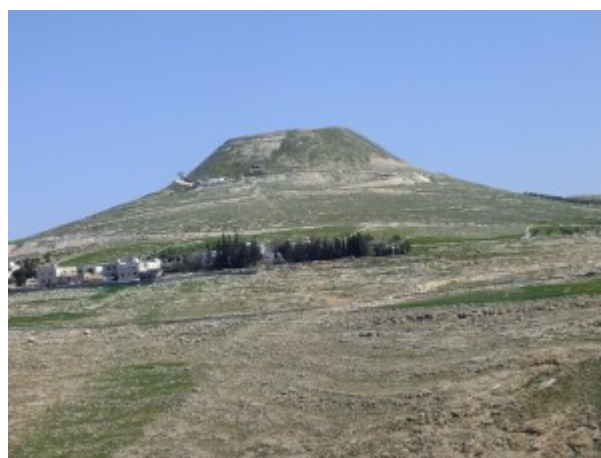
מבצר הרודיון.

נץ-חלב נטוי Ornithogalum nutans שהוא מין מזרח ים תיכוני הגדל בתורכיה יוון והבלקן ושכיח גם בגינון באירופה, ול- Ornithogalum boucheanum הגדל במזרח אירופה. מעמדה הסיסטמטי של האוכלוסייה בישראל טרם נקבע סופית ולא ברור האם זהו מין עצמאי או זן של המין נץ-חלב נטוי . התכונה של פרחים משתלשלים לא קיימת בשאר המינים הגדלים בישראל ואופיינית לקבוצת נץ-חלב נטוי. נץ-חלב הרודיאני נבדל מהאוכלוסיות של נץ-חלב נטוי בעליו הצרים, ובכך שכנפי זירי האבקנים חסרי שיניים. מאחר ובכל מקרה מין זה שונה משאר המינים המוכרים בישראל, ניתן לו שם עברי, על שם מבצר הרודיון המשקיף על נחל תקוע שבמצוקיו נתגלה המין.