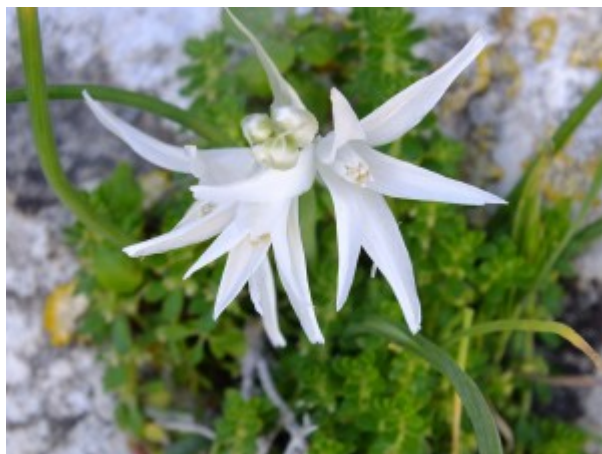
נץ-חלב הרודיאני. להגדלה - לחצו על התמונות

בסוג נץ-חלב ישנם כ 275 מינים הגדלים בכל היבשות מלבד אוסטרליה. מוצאו של הסוג כנראה מדרום אפריקה. תרגום שמו המדעי של הסוג הוא חלב ציפורים, שמו העברי של הסוג ניתן לו על שם של צמח בשם נץ-חלב המופיע במשנה במסכת שביעית, והדמיון לתרגום השם המדעי.