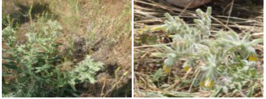
סומקן ענקי.