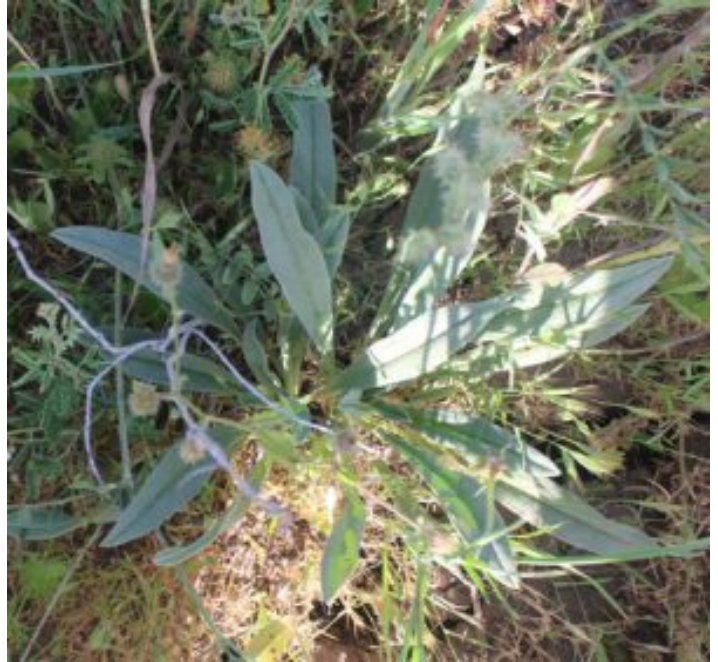
סומקן ענקי.

מימין - צמח צעיר בסוף אפריל, הפרט הזה יישאר עם שושנת העלים ולא יפתח גבעולי פריחה. עלי השושנת אזמלניים מוארכים משמאל - עלי הגבעול התחתונים דומים לעלי השושנת ומצטרפים בבסיסם ובראשם, העלים העליונים יותר רחבים בבסיסם ומצטרפים רק כלפי ראשם וקצרים יותר מהעלים התחתונים