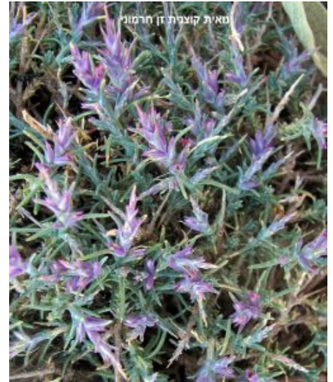
נואית קוצנית זן חרמוני מימין - צילמה: ערנה אלוני ©; משמאל - צילם: גדי פולק © להנדלה - לחצו על התמונה

הצמח אינו מוכר כצמח מרפא או לתועלת לאדם, אולם בדיקות פיטוכימיות שבדקו את תכולת החומרים בגוף הצמח במצרים, הראו שמצויים בו חומרים רבים כמו פלבנואידים, טאנינים, כלורידים וסולפידים בכמות לא גבוהה וכן חומרים נוספים כמו סוכרים ומעט חומצות אמינו.