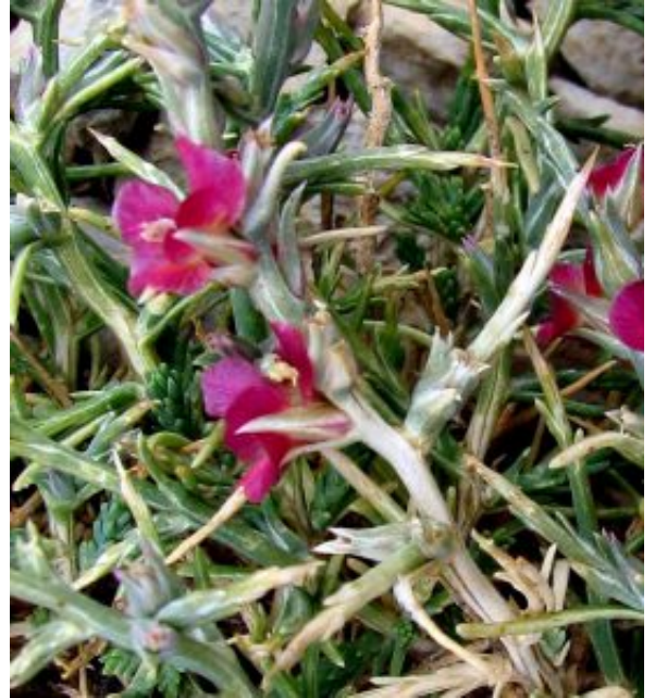
נואית קוצנית בפריחה מימין; משמאל להגדלה - לחצו על התמונות

תפוצתה העולמית של נואית קוצנית רחבה והיא מצויה במרכז אסיה, בערבות רוסיה, במזרח התיכון, בהרי האטלס ובצפון אפריקה ברחבי האיזור האירנו-טורני. בארץ היא גדלה במדבר על מגוון קרקעות וסלעים ממקור גירני אך אינה גדלה על סלעים ממקור מגמתי. הצמח שכיח על מדרונות לס וקירטון בספר המדבר, בערוצי ואדיות בנגב הצפוני, ועל סלעים במדבר הקיצוני. בהר הנגב היא מלווה חשוב בחברת לענת המדבר ובגבעות לס וקירטון בצפון הנגב היא צמח שולט. בחגורת הצומח הכרקוצי (טרגקנטי) בחרמון עד לרום של קרוב ל- 3000 מ', מוכרות אוכלוסיות של נואית קוצנית , שם הפרטים גדלים ככרים נמוכים, צפופים וקוצניים. באוכלוסיות אלה הצמחים העלים, הגבעולים, וחפי הפרחים מצטיינים בגוון סגול. זוהי נואית קוצנית זן חרמוני אשר יש המחשיבים אותה כמין נפרד.