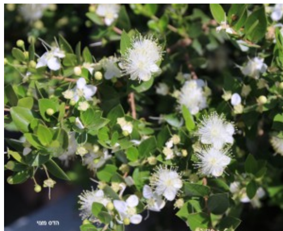
הדס מצוי בפריחה. העלים פשוטים.