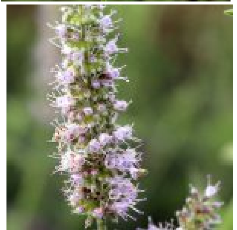
נענה משובלת - תפרחות. להגדלה - לחצו על התמונות