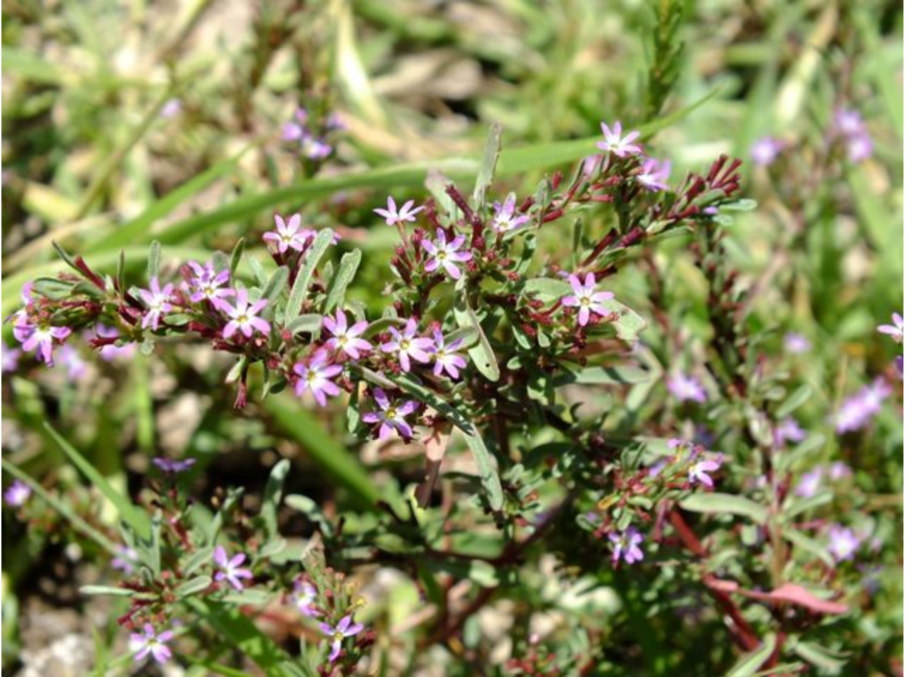
שנית שוות-שיניים - מראה כללי. העלים והפרחים מפזורים לאורך הגבעול, ראש העלים קהה, הפירות סרגליים, הגבעולים והפירות מאדימים.

שנית שוות-שיניים נובטת בשטחים מוצפים ובעיקר בשלוליות חורף מתייבשות ומצמיחה גבעולים מרובעים וקרחים. הגבעולים שרועים או מזדקרים אלכסונית ונושאים עלים כמעט לכל אורכם, רוב העלים מסורגים אך לעיתים קרובות העלים בבסיס הגבעול נגדיים. העלים סרגליים וראשם קהה. הפרחים מתפתחים לאורך הגבעולים מבסיס הגבעול כלפי מעלה. לגביע 12 שיניים, 6 שיניים חיצוניות ו-6 שיניים פנימיות. אורך השיניים החיצוניות כ-0.5 מ"מ ואורך הפנימיות דומה או מעט קצר יותר. בשלב הניצן שיני הגביע החיצוניות והפנימיות נוטות כלפי פנים וסוגרות את הפרח מלמעלה. בשלב פתיחת הפרח מזדקפות כל שיני הגביע ורק אז ניתן להבחין בהן בין עלי הכותרת; בשלב הפרי השיניים חוזרות וסוגרות על הפרי מלמעלה. לפרח 6 עלי כותרת ורודים ודמויי אזמל, אורכם כ-5 מ"מ. חלקה התחתון של הכותרת צינורי ואילו חלקה העליון פתוח לרווחה. 6 האבקנים ועמוד העלי חבויים בתוך צינור הכותרת וקשה להבחין בהם מבחוץ.