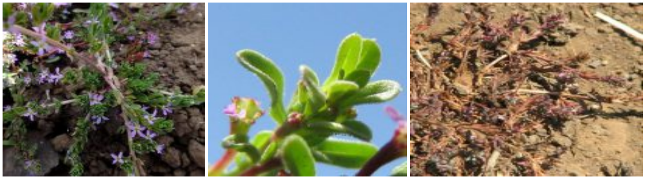
שנית שוות-שיניים. מימין - סוף פריחה והבשלת פירות; במרכז - גביע הפרח לאחר הסרת הכותרת, 12 שיני הגביע כמעט שוות באורכן; משמאל - בחלק מהפרחים רואים הפחתה של מספר עלי הכותרת ל-5 או ל-4. להגדלה - לחצו על התמונות

בחלק ניכר מהפרטים באוכלוסיה יש הפחתה של מספר אברי הפרח (שיני גביע חיצוניות/פנימיות, עלי כותרת ואבקנים) ל-5 או אפילו ל-4, אך לא באופן אחיד בפרט הצמח. כלומר, יתכן שבחלק מהפרחים בצמח תהיה הפחתה ובחלק אחר לא או שבחלק מהאברים ובייחוד בכותרת תהיה הפחתה אך לא באברים האחרים. הפרי מוארך וסרגלי, סגור ע"י שיני הגביע הפנימיות, שיני הגביע החיצוניות נוטות כלפי מרכז הפרי. הצמח נוטה להאדים במקרה של עקת מים ובעת הבשלת הפרי ואז הגבעולים והפירות מאדימים והעלים נושרים. שנית שוות-שיניים פורחת בהתאם למהלך קצב התייבשות הקרקע בבית גידולה הלח וניתן למצוא אותה בפריחה החל מחודש פברואר ועד חודש ספטמבר.