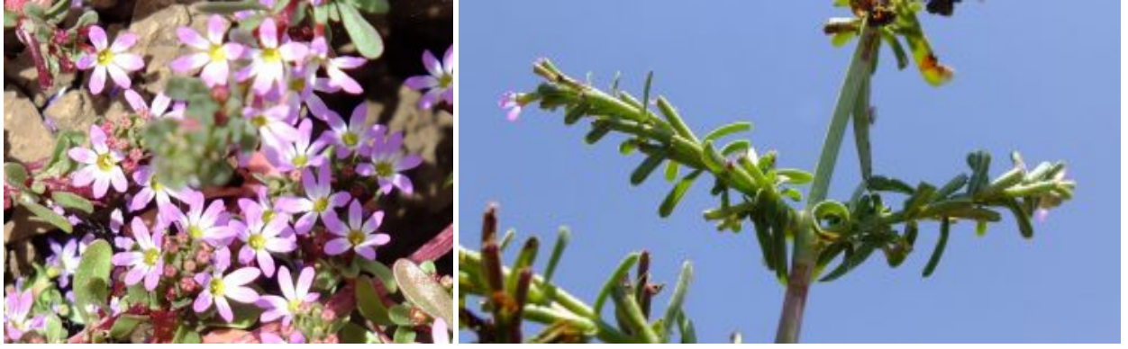
שנית שוות-שיניים. מימין - הגבעול מרובע וקרח; משמאל - פרחים, 6 האבקנים חבויים בתוך צינור הכותרת, בפירות המתפתחים שיני הגביע החיצוניות נסגרות פנימה להגדלה - לחצו על התמונות

בחלק ניכר מהפרטים באוכלוסיה יש הפחתה של מספר אברי הפרח (שיני גביע חיצוניות/פנימיות, עלי כותרת ואבקנים) ל-5 או אפילו ל-4, אך לא באופן אחיד בפרט הצמח. כלומר, יתכן שבחלק מהפרחים בצמח תהיה הפחתה ובחלק אחר לא או שבחלק מהאברים ובייחוד בכותרת תהיה הפחתה אך לא באברים האחרים. הפרי מוארך וסרגלי, סגור ע"י שיני הגביע הפנימיות, שיני הגביע החיצוניות נוטות כלפי מרכז הפרי. הצמח נוטה להאדים במקרה של עקת מים ובעת הבשלת הפרי ואז הגבעולים והפירות מאדימים והעלים נושרים. שנית שוות-שיניים פורחת בהתאם למהלך קצב התייבשות הקרקע בבית גידולה הלח וניתן למצוא אותה בפריחה החל מחודש פברואר ועד חודש ספטמבר.