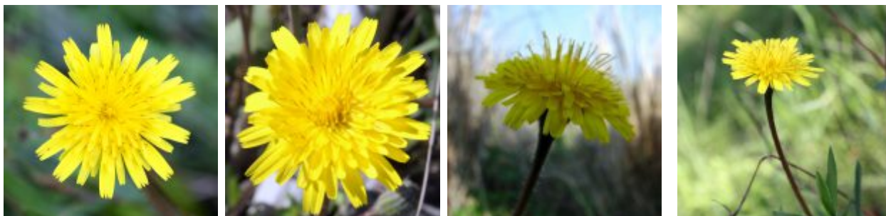
כתמה עבת-שורשים תמונות בסדר 1-4 מימין לשמאל - 1. הקרקפת נישאת על גבעול ארוך. צילמה: ערגה אלוני ©; 2. מראה מהצד של הקרקפת. בפרחים המרכזיים נראות הצלקות. צילמה: יעל אורגד ©; 3. קרקפת הנושאת פרחים לשוניים. במרכז בולט העלי של פרחי הדורים הפנימיים. צילמה: ערגה אלוני ©; 4. בפרחים הלשוניים התאחו על הכותרת לצורת לשון מוארכת. הקצה משונן. במרכז העליים של הפרחים הפנימיים. צילמה: ערגה אלוני © להגדלה - לחצו על התמונות

עשרות פרחים לשוניים, יושבים בצפיפות על המצעית. הם נפתחים ביום ונסגרים בלילה. הדור החיצוני הפרחים בעלי גוון כהה בצדם האחורי. הלשון ארוכה והיא למעשה איחוי של 5 אונות כותרת שהתאחו והתארכו. מספר האבקנים בכל פרח 5 והם יושבים על צינור הגביע. העלי בולט מבניהם. השחלה תחתית עשויה 2 עלי שחלה. הפרחים יוצרים אבקה הנאספת ע"י דבורים המאביקות של הפרחים.