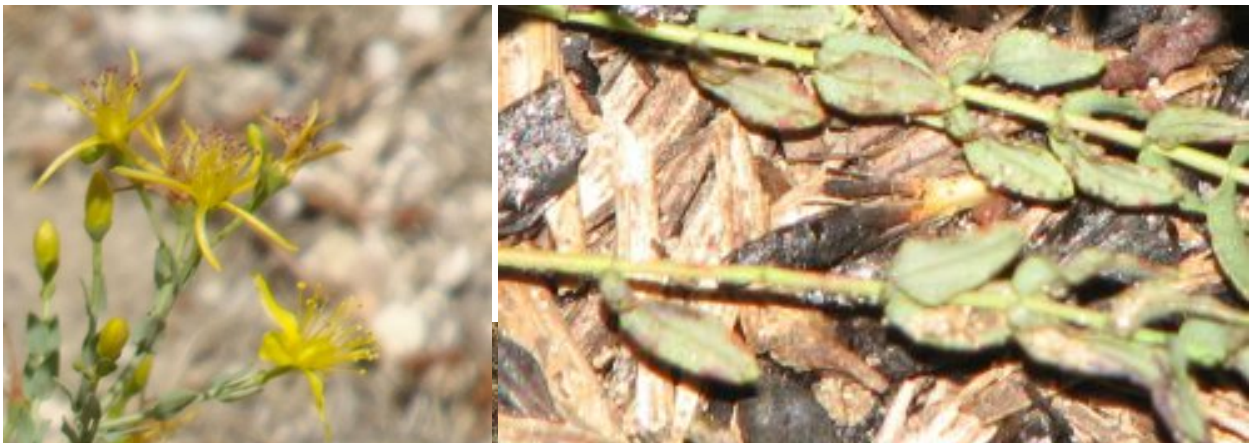
פרע מסולסל. מימין - בלוטות שחורות בצידם התחתון של חלק מהעלים משמאל - הפרחים נושאים בודדים בראשי הענפים, זוגות פרחים נוספים יוצאים מחיקי העלים להגדלה - לחצו על התמונות

הגבעולים נושאים עלים לרוב אורכם, העלים מסודרים בזוגות, וכל זוג עלים הוא בזווית של 90 מעלות ביחס לזוגות הקרובים. העלים תמימים, משולשים כלפי ראשם, בסיסם דמוי לב וזוג העלים נראה כלופת את הגבעול. עלי הקיץ קצרים (אורכם כ-4 מ"מ) ושפתם איננה מסולסלת. צידם התחתון של העלים מנוקד בבלוטות שחורות המכילות שמנים אתריים.