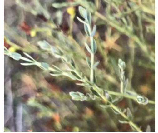
פרע מסולסל. מימין - גבעולי המשנה יוצאים בזוגות נגדיים ובזווית של כ 45 מעלות לגבעול הראשי משמאל - פרט סבוך, אופייני לשיא הקיץ וסופו להגדלה - לחצו על התמונות

הגבעולים נושאים עלים לרוב אורכם, העלים מסודרים בזוגות, וכל זוג עלים הוא בזווית של 90 מעלות ביחס לזוגות הקרובים. העלים תמימים, משולשים כלפי ראשם, בסיסם דמוי לב וזוג העלים נראה כלופת את הגבעול. עלי הקיץ קצרים (אורכם כ-4 מ"מ) ושפתם איננה מסולסלת. צידם התחתון של העלים מנוקד בבלוטות שחורות המכילות שמנים אתריים.