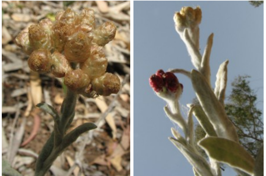
דם המכבים האדום

פרחים. כדי למנוע את הכחדת המין עקב שימוש מסחרי הוכרז המין כצמח מוגן. דם-המכבים האדום אנדמי ללבנט.