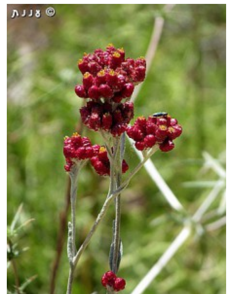
דם המכבים האדום - סמל ביום הזכרון.

דם-המכבים האדום הוא צמח עשבוני רב שנתי, שכל חלקיו העליונים מתייבשים בקיץ, אך השורשים מכילים ניצני התחדשות מהם בוקעת שושנת עלים בחורף. רק לקראת האביב עולה הגבעול הזקוף. מבין עלי השושנת. עלי השושנת ועלי הגבעול אזמלניים ותמימים עלי השושנת מאורכים. הגבעולים והעלים מכוסים שערות לבדניות העלים על הגבעול חסרי פטוטרת. אורך הגבעול כחצי מטר והוא מסתעף בחלקו העליון.