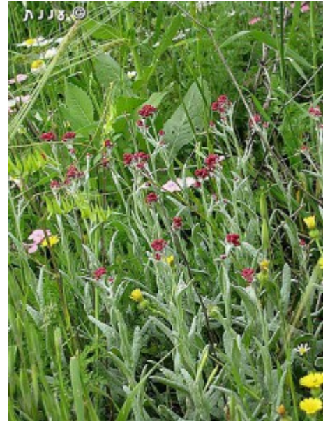
דם המכבים האדום - מראה כללי, העלים לבדניים.

דם-המכבים האדום פורח בחודשים אפריל מאי. בראש הענפים העליונים מתפתחות מספר קרקפות פרחים קטנות שקוטרן כחצי ס"מ, הקרקפות הזעירות והרבות משוות לצמח הפורח מראה של סוכך. הקרקפות עטופות בחפיות רבות ורעופות שצבען אדום בדרך כלל. וכמו כל מיני הסוג צבע החפיות נשמר אף לאחר התיבשות הצמח. בתוך הקרקפת ישנם פרחים צינוריים רבים, מהם בולטים כלפי מעלה רק המאבקים הצהובים. הזרעונים קטנים (כ-1 מ"מ) וצורתם גלילית, בראש הזרעונים ישנה ציצית לא מנוצה.