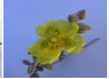
שמשון סגלגל. פרח ותפרחת להגדלה - לחצו על התמונות

פרחי שמשון סגלגל צהובים וקוטר הכותרת 1.5-2 ס"מ. בפרח 5 עלי גביע שעירים, שני החיצוניים קטנים משלושת הפנימיים. כמו כל פרחי משפחת הלוטמיים הם מרובי אבקנים ומעניקים למבקרים ולמאביקים אבקה. במרכז הפרח ממוקמים השחלה שלה 3 מגורות, עמוד העלי וצלקת ירקרקה בראשו. מהשחלה מתפתח הלקט מרובה-זרעים העטוף בגביע השעיר, הנפתח ביובש ב-3 קשוות.