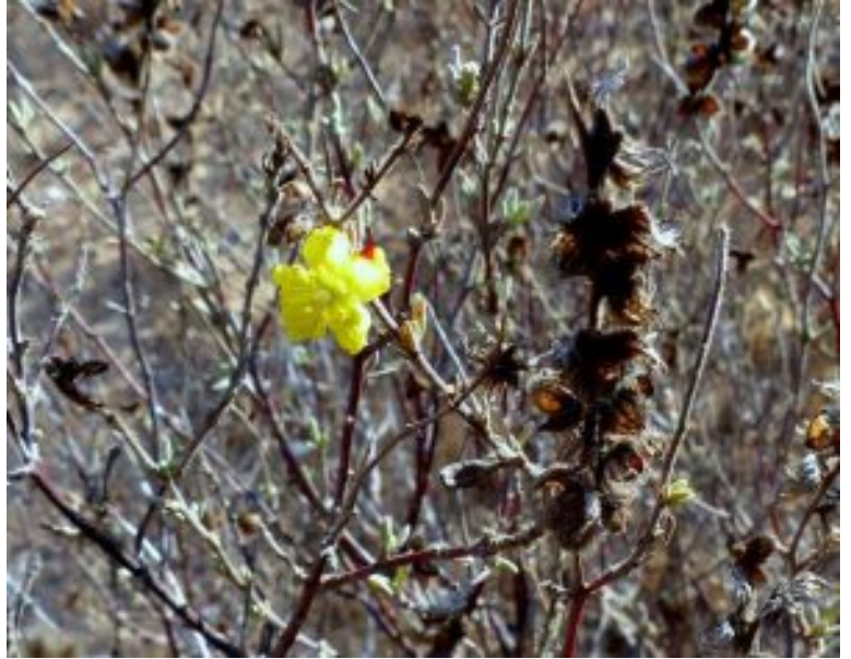
שמשון סגלגל. פירות בעת הפצת הזרעים להגדלה - לחצו על התמונות

שמשון סגלגל גדל בארץ בחולות הנגב המערבי ובבתי גידול חוליים לאורך מישור החוף - בחולות יציבים, בחמרה חולית ועל גבי כורכר פריך וחולי. בגבעות כורכר הוא שכיח יותר במפנים דרומיים. שמשון סגלגל הוא צמח שולט בחברות הצמחים של טור הסוקצסיה על חולות מיוצבים במישור החוף ומופיע לרוב יחד עם רותם המדבר ובמקומות עשירים יותר בחומר אורגני גם יחד עם אלת המסטיק . תפוצתו העולמית היא בעיקרה סהרו-ערבית עם חדירה לאזור הים-תיכוני. ידוע מסיני, צפון מצרים, צפון אפריקה, טורקיה, קפריסין, כרתים ובאיי יוון ניתן רק באי זקינתוס.