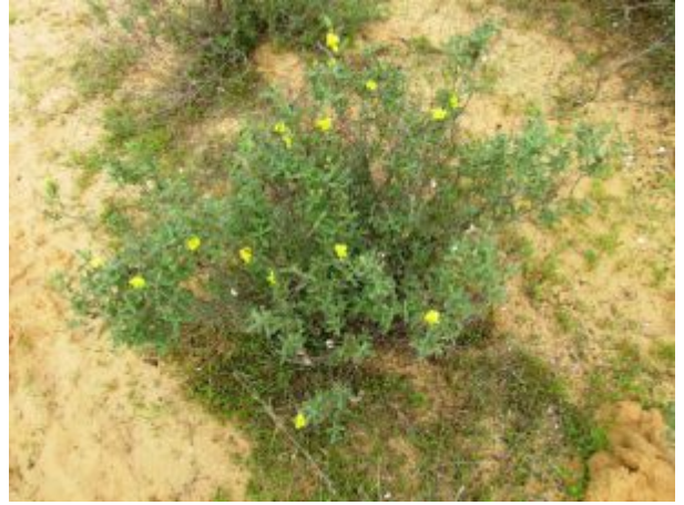
שמשון סגלגל. מימין - מראה כללי; משמאל - ענפים ועלים. להגדלה - לחצו על התמונות