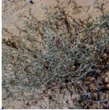
חמד המדבר, מימין ובאמצע השיח בנוף הצחיח של המדבר. צילם מורי חן © המקור צמח השדה. באמצע שיח ענף ונמוך. משמאל: ענפים פרוקים למפרקים בשרניים. צילמה ערגה אלוני ©

הפרחים דו-מיניים ירוקים קטנים שאינם בולטים (פינברון-דותן , דנין, 1991). להם 5 עלי עטיף מפורדים, 5 אבקנים, שחלה עילית בת ביצית אחת ובראשה צלקות שעירות. עם הבשלת הפרי מתפתחת כנף אופקית באמצע גבו של כל עלה עטיף. צבע הכנפיים אינו אחיד והוא משתנה בין גוון צהוב חיוור, ורוד או ארגמן. הכנפיים בולטות ביופיין ועוזרות לתפוצה הפרי באמצעות הרוח. הפרי שקיק גודלו 6-8 מ"מ (Zohary. 1966 נתון בעטיף ומונח אופקית. העובר סיליני מקביל למצעית. חמד המדבר פורח באוקטובר-נובמבר. הפרי מבשיל בחורף כנפיו משחירות ואז נפוץ.