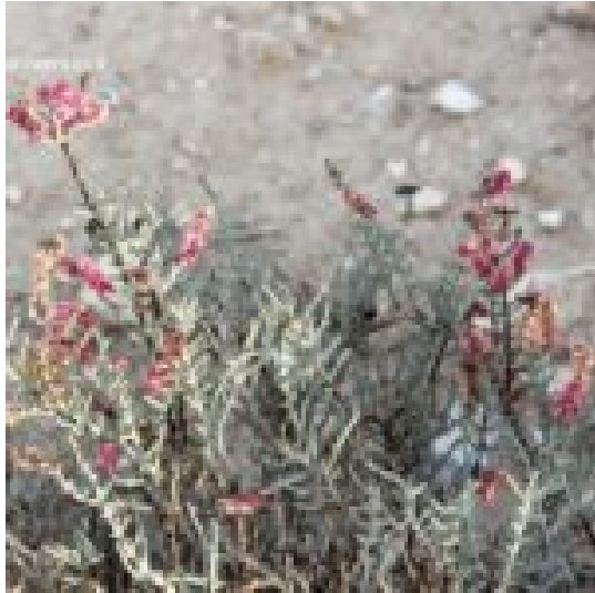
חמד השיח, מימין ומשמאל כנפי הפרי המקנים לצמח צורה של שיח במלוא פריחתו.

חמד המדבר הוא צמח תועלת שכיח בהרי האטלס בדרום מערב אלג'יריה והוא משמש לטיפול בתחלואי גוף וכמזון לבעלי חיים במדבר בעיקר לגמלים. סקר אתנובוטני באזור הראה ש-45% מהאוכלוסייה משתמשת בנוזל הנסחט מהצמח כנגד עקיצות עקרבים ונחשים, לטיפול במחלות בדרכי העיכול, פציעות, דלקות עור וסוכרת (Boucherita et al 2018). בחצי האי סיני, הבדואים גם הם, סוחטים את גבעולי הצמח ומשתמשים בו להבראת נפיחות באברים וכנגב כאבי שרירים (גרנות 2014). המרכיבים הכימיים החשובים העוזרים לטיפול בתחלואי גוף הם אלקלואידים ופלבנואידים. נמצא שחומרים אלה גם קוטלים זחלי חרקים. בניסויים במעבדה נמצא שהם יכולים לעכב התפתחות תאים סרטניים.