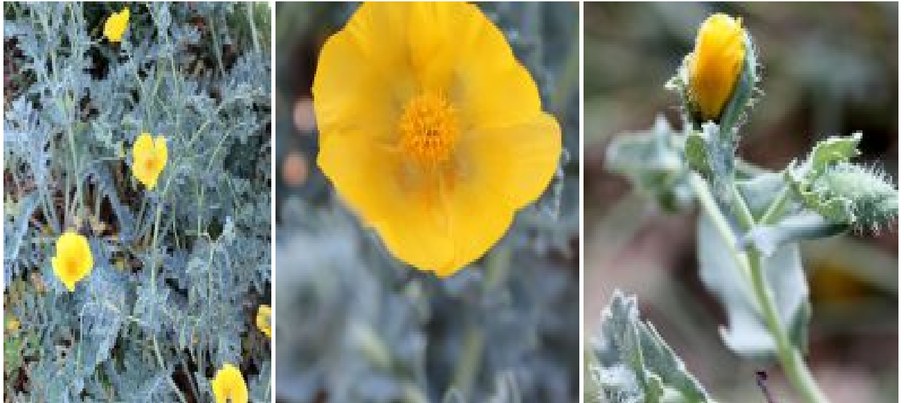
פרגה צהובה. מימין - הגביע לפני נשירתו בעת פתיחת הפרח; במרכז - פרח בשיא פריחה; משמאל - צמח עם פרחים גדולים ובולטים להגדלה - לחצו על התמונות

הפרח קצר-חיים; לאחר כמה שעות פריחה נושרים עלי הכותרת. לאחר ההפריה הצלקת משנה את צורתה עם התפתחות הפרי: היא מזדקרת מעלה ונראית כשתי קרניים. הפרי תרמיל ישר, מגובשש, אורכו 15-30 ס"מ ומכיל זרעים רבים קטנים. הוא מתייבש, נפתח בשתי קשוות ומפזר זרעים.