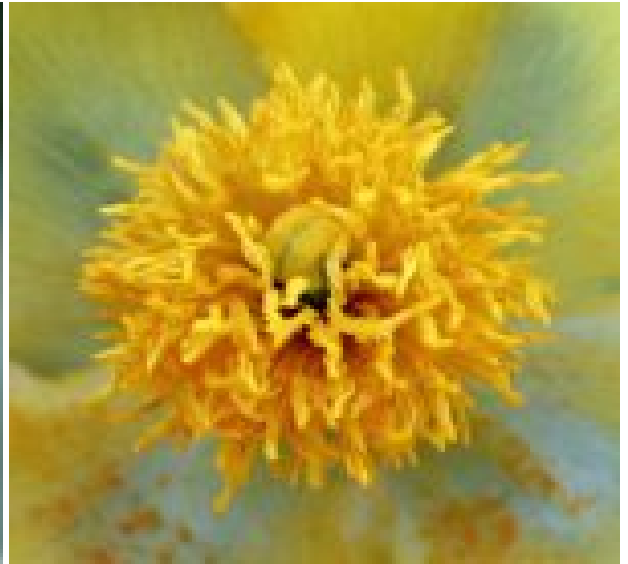
פרגה צהובה. מימין - אבקנים בוגרים וצלקת חבויה ביניהם; במרכז - עמוד עלי וצלקת דמוית חץ; משמאל - צלקת בוגרת דמוית קרניים להגדלה - לחצו על התמונות

כל חלקי הצמח כולל הזרעים - רעילים. האלקולואיד המצוי ביותר הוא גלאוצין (Glaucin) המשפיע בעיקר על שיבוש קליטת חמצן בשלפוחיות הריאה, מה שגורם לנזק נשימתי. החומר עלול לגרום גם לאירוע מוחי, וכן לעייפות, הזיות ולבעיות עיכול.