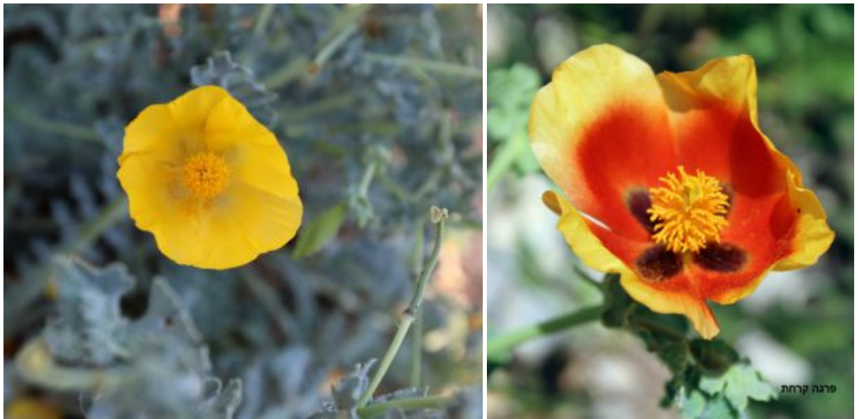
מימין - פרגה קרחת; משמאל - פרגה צהובה.

המין הקרוב לפרגה הצהובה היא פרגה קרחת הגדלה בחרמון.