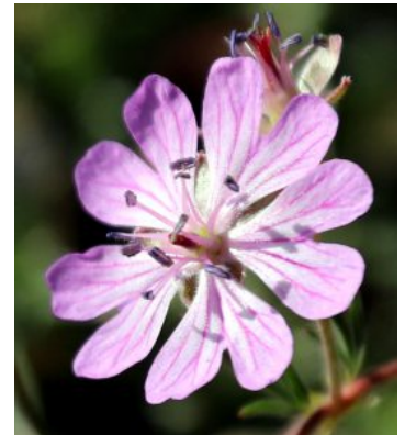
מימין: פרח בשלב מיני זכרי. באמצע ומשמאל: פרחים בשלב מיני נקבי, המקדים להתבגר.

הפרי המתפתח הוא מפרדת בת 5 פרודות צמודות לציר המרכזי. עם הבשלתן, הן נפרדות מבסיס הציר ומתעגלות כלפי מעלה. לכל פרודה זרע ומקור ארוך. הזרע שהוא יחידת התפוצה נמצא בקצה החופשי. הפרודות ניתקות בהבשלתן, ונזרקות לסביבה.