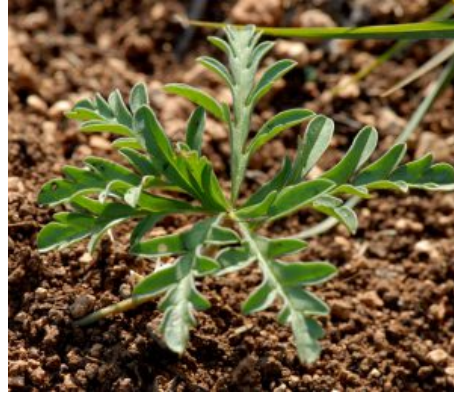
מימין ומשמאל: העלים הראשונים הפורצים מהפקעת שבקרקה.

הגבעול עשבוני, בעל מפרקים בולטים ומעט תפוחים, מתנשא לגובה 20-30 ס"מ. צבעו חום אדמדם, עטור שערות לבנות רכות. במפרקי הבסיס, עד להסתעפות הראשונה הוא חסר עלים. במפרקים הבאים העלים מסורגים, קטנים מאלה בבסיס. צורתם דמוית כף יד, שסועים לאונות עמוקות מחודדות בקצותיהן, שפתם לרוב תמימה. על הגבעול בחלקו העליון יתכנו 1-2 זוגות עלים.