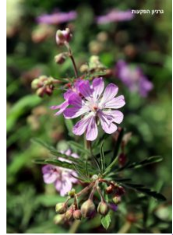
מימין באמצע ומשמאל: גבעולים נושאי פרחים.

הפרח גדול (3 ס"מ), סימטרי ומרשים. עלי הגביע 5 ירוקים ושעירים באורך 3-5 ס"מ, בסיסם מורחב והקצה מחודד. 5 עלי הכותרת צבעם ורוד ארגמן, צרים בבסיסם ומתרחבים בהמשך. כל עלה משונץ לשתי אונות עד שליש מאורכו, עטור ב"קווי צוף" ארגמניים המתפצלים בחלק המורחב של הכותרת. בין כל שני עלי כותרת מצוי צופן.