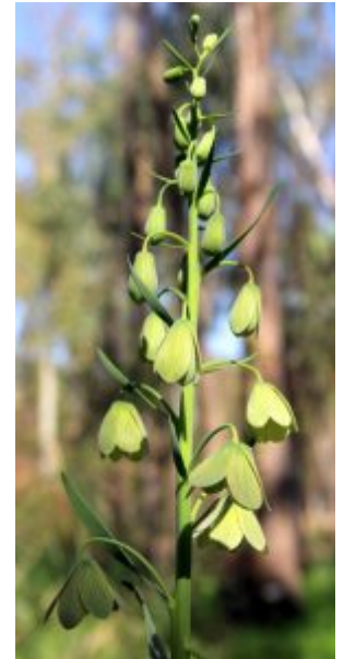
גביעונית הלבנון. לצפייה מיטבית - לחצו על התמונות

התפרחת אשכול המתפתח בראש הגבעול, לאורכו 10-40 פרחים היושבים על עוקץ ומלווים בעלה חפה. צורת הפרחים דמוית פעמון והם נטויים מטה. העטיף כותרתי בן 6 עלים מפורדים, בבסיסם מצוי צופן. צבע הפרחים אינו אחיד: מירוק-צהבהב ועד לארגמן (בעבר נחשבו הצמחים שצבעם ארגמן כמין נפרד - גביעונית ערבית). רשת עורקים סגולים חומים מעטרת כל עלה בפרטים הבהירים. במרכזם 6 אבקנים בעלי מאבק גדול. השחלה עילית נמוכה מהאבקנים. האבקה החדית נעשית על ידי חרקים הנמשכים לצוף ולאבקה בעיקר דבורי דבש, וצרעות. משך חי הפרח כשבוע וחצי.