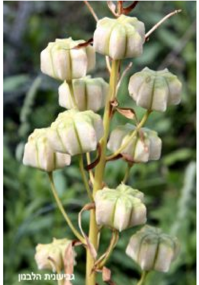
גביעונית הלבנון. מימין - פירות; משמאל - הזן בעל הפרחים הארגמניים (גביעונית ערבית)

התפוצה הגיאוגרפית של גביעונית הלבנון היא מזרח ים-תיכונית ומערב אירנו-טורנית - בארץ-ישראל, סוריה, לבנון, דרום טורקיה והיא מצויה גם בעירק ואירן. בארץ המין אינו שכיח. ניתן למצוא את גביעונית הלבנון בגליל העליון, אך היא נדירה באזורי ההר האחרים. בנוסף היא גדלה גם בספר הים-תיכוני באזור הגלבע ובדרום הררי יהודה. בית הגידול הוא חורש ובתה באזורים סלעיים על קרקע טהה רוסה, אך גם בקרקעות לס.