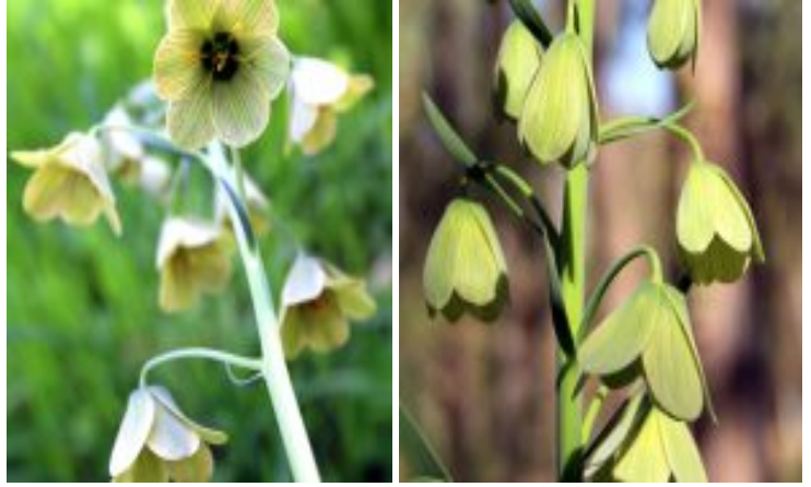
גביעונית הלבנון - פרחים. לצפייה מיטבית - לחצו על התמונות

לאחר ההפריה נושר הפרח, העוקץ מתיישר והפרי מזדקף. הפרי הלקט גדול משושה, הזרעים רבים, דמויי דיסקוס מכונף, צבעם חום, והם ערוכים בפרי בצפיפות. עם הבשלת הזרעים בתום הקיץ, ההלקט נפתח והזרעים מופצים ע"י הרוח המניעה את הגבעול. הזרעים נובטים בחורף. בשלוש שנים ראשונות הם מצמיחים עלה אחד. בשנה הרביעית צומח גבעול בעל עלים, ורק בשנה החמישית יש פרחים. הצמח מתרבה ברבייה מינית ע"י זרעים וכן ע"י התפתחות בצלים קטנים מבסיס הבצל הבוגר.