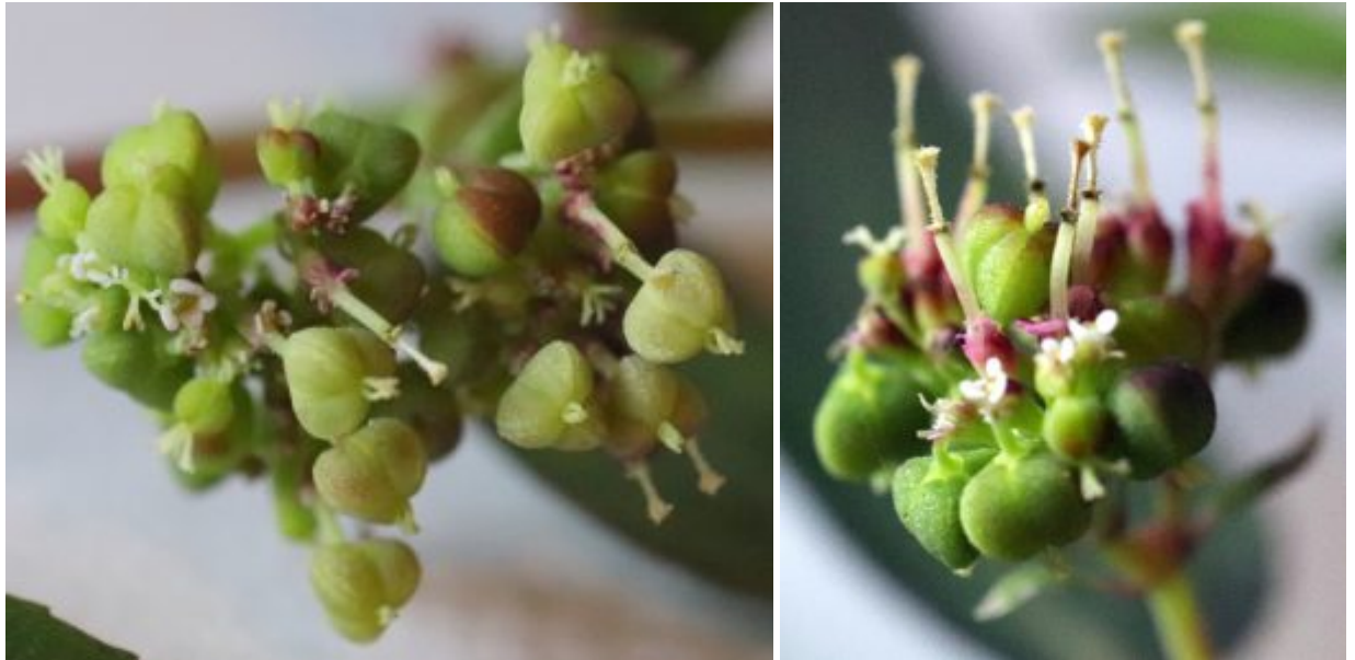
חלבולב נטוי - השלב הזכרי ופירות (הלקטים) צעירים. צילמה: ערנה אלוני © להנדלה - לחצו על התמונות

חלבולב נטוי גדל בריכוזים צפופים, סמוכים אלה לאלה. מה שמלמד שגודלו של בנק הזרעים בקרקע הוא לא מבוטל. ספירת הלקטים בצמח שעדין מייצר פרות חדשים הראתה שבממוצע, על כל מפרק מצויים 15 הלקטים. מספר הסוככים הממוצע היה 10. כך שצמח אחד מייצר לפחות 150 הלקטים סה"כ 550 זרעים. פיזור הזרעים נעשה ע"י פתיחת קשוות ההלקט ושחרור הזרעים. הזרעים חלקם, נאספים ע"י נמלים ומורחקים מצמח האם. הם מופצים לסביבה ונובטים בקלות. למעשה, צמח בוגר אחד, בעונת גידול מקיים יותר ממחזור חיים אחד.