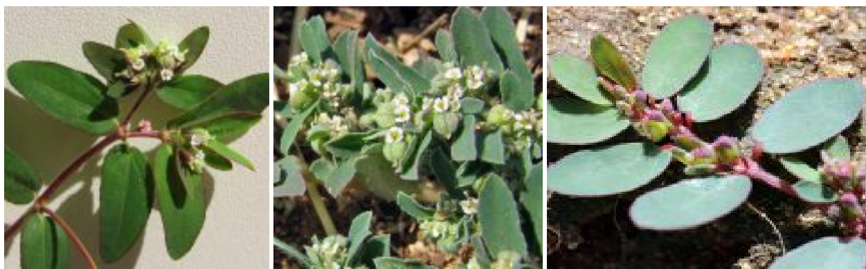
מימין - חלבוב פושט. צילמה: ערנה אלוני © במרכז - חלבוב מאדים. צילם: נעם עביצל ©, באדיבות אתר צמח השדה משמאל - חלבוב שעיר-פרי. צילמה: ערנה אלוני © להגדלה - לחצו על התמונות

בשם E. nutans (זהרי, 1976), שמו הוחלף ב-1991 לשמו הנוכחי. חיפוש השם המדעי הנוכחי באתרי צמחים, יציג מין של חלבוב הזוחל על פני הקרקע, שהתיאור שלו מתייחס ל חלבוב מאדים E. supine (ע"פ המגדיר בארץ) או ל חלבוב פושט E. prostrata . שני מינים אלה הם צמחים נמוכים זוחלים על פני הקרקע. לשניהם בלוטות כוסית שונות והראשון בעל גבעול והלקט שעירים. תוצאת החיפוש של חלבוב נטוי ברשת בשמו הקודם ( E. nutans ) תואם לפרטי-ה חלבוב הנטוי . מין דומה לו הגדל בארץ הוא חלבוב שעיר-פרי E. lasiocarpa , צמח גבוה דומה במבנה אך הגבעול וההלקט שעירים. עד שיתבררו הדברים לאשורם, נמשיך להשתמש בשם המין המדעי של חלבוב נטוי , כפי שמופיע במגדיר.