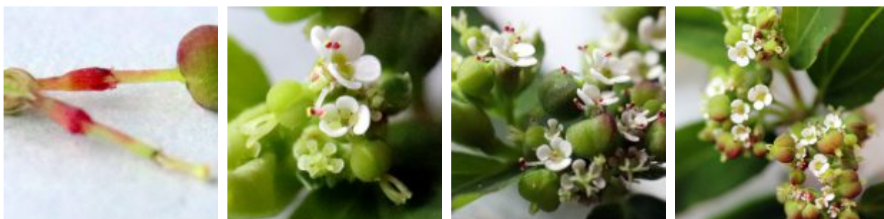
חלבוב נטוי - תפרחות ופרחים.

מצוי פרח עלייני-נקבי אחד ובצמוד לו בתוך הכוסיות פרחים אבקניים -זכריים שכל אחד מכיל אבקן אחד בלבד. הפרח הנקבי שקוע בכוסית טרם הבשלתו ורק קצות אונות הצלקת מבצבצות החוצה. כאשר הפרח מתבגר, הוא מתרומם על עמוד קצר עליו יושבת שחלה חלקה בת 3 מגורות. בראשה שלוש צלקות לבנות כל אחת מפוצלת לשתי אונות הפונות לצדדים. הפרח הנקבי מבשיל לפני הפרחים הזכריים (פרוטוגיניה) ובכך קטן הסיכוי להפרייה עצמית.