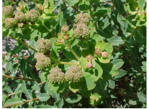
פירות של חלבולב מגובשש מימין; משמאל להגדלה - לחצו על התמונות

בית הגידול האופייני של חלבולב מגובשש הוא סלעים, מצוקים וגדרות אבן במדרונות גיר ובזלת בחבל הים-תיכוני ובחגורת הספר - שם לעתים הוא מין שולט בחברה. הוא נפוץ מאד בגולן ובגליל המזרחי. תפוצתו העולמית כוללת את ישראל, ירדן, סוריה, לבנון, טורקיה וארצות הקווקז.