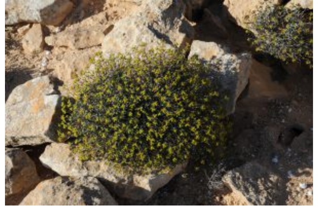
חלבוב רמון. בתמונה משמאל - מופע קיצי בשלכת להגדלה - לחצו על התמונות

שמו של חלבוב מגובשש בערבית הוא " חוליבה" או " גרוואה". באנגלי הוא מכונה Jerusalem Spurge .