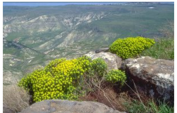
חלבולב מגובשש בסלעים. להגדלה - לחצו על התמונות

מין קרוב ל חלבולב מגובשש הוא חלבולב רמון Euphorbia ramanensis , מין תת-אנדמי הגדל בארץ בעיקר בהר הנגב ובסיני ונבדל מ חלבולב מגובשש בין היתר בגבעוליו הסגולים ובעלים קטנים יותר. יש הרואים ב חלבולב רמון זן של חלבולב מגובשש . מין מעוצה נוסף של חלבולב הגדל בארץ הוא חלבולב השיח Euphorbia dendroides - מין "אדום" הגדל רק במורדות הכרמל המערביים. כל יתר מיני החלבולב בארץ הם עשבוניים, רובם חד-שנתיים.