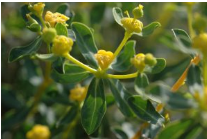
תפרחות של חלבוב מגובשש מימין; משמאל להגדלה - לחצו על התמונות

לאחר ההפרייה הפרח הנקבי נוטה הצידה אל מחוץ לכוסית והפרחים הזכריים עולים מתוך הכוסית עם המאבקים הבשלים. שחלת הפרח מתפתחת לאחר ההפרייה לפרי הלקט בקוטר של 4-6 מ"מ ששטח פניו מכוסה בגבשושיות (מכאן תואר שם המין) ובכל אחת מ-3 המגורות זרע אחד.