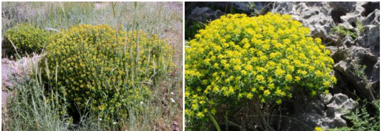
חלבולב מגובשש - מראה כללי בעת הפריחה מימין - צילם: גברי שיאון ©; משמאל - צילמה: ערגה אלוני ©

חלבולב מגובשש Euphorbia hierosolymitana (חלבולביים) הוא בן-שיח בעל צורה כדורית וצפופה שגובהו לרוב 30-50 ס"מ וקוטרו מגיע ל-60-70 ס"מ. ענפיו אשונים והעלים מסורגים, מוארכים (1.5-5 ס"מ) ותמימים. כל אברי הצמח מכילים מוהל חלבי לבן וצמיג הניגר מהם כאשר פוצעים אותם. חלבולב מגובשש מבלבל לאחר רדת גשמי החורף הראשונים ומשיר את עליו לקראת הקיץ. בקיץ הוא מצוי בשלכת מלאה. בראשית הקיץ ענפיו גוון אדמדמם ההולך ומצהיב לקראת סוף הקיץ. חלבולב מגובשש הוא אחד מבני השיח והשיחים המועטים בחבל הים-תיכוני בארץ העומדים בשלכת בקיץ ללא איבר הטמעה ירוק ודומים לו בכך צחנן מבאיש, חלבולב השיח ואטד החוף .