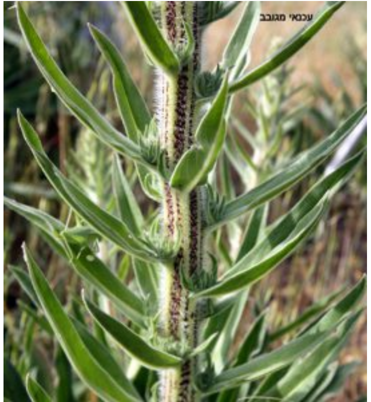
עכנאי מגובב - גבעול ועלים. העלים יושבים, הזיפים בהירים והגבעול מפוספס לעתים בחום-ירוק

הפרחים מגובבים בתפרחת, מסודרים על ענפים קצרים המתפתחים בחיק העלים. הפרח דו מיני, צבעו ורוד חיוור, ארכו 13-20 מ"מ. הגביע מאוחה בבסיסו ולו 5 שיניים קצרות וחדות. הכותרת הנתונה בגביע, מאוחה דמוית משפך א-סימטרי או צינור מתרחב שבקצהו 5 שיניים קצרות מעוגלות. בפרח 5 אבקנים שאורך זיריהם אינו שווה. הם ארוכים, ורודים אדמדמים, המאבקים קטנים, עגולים ותכולים. עמוד העלי גבוה מיתר אברי הפרח; שסוע בקצהו לשתי אונות בדומה ללשון נחש העכן. עכנאי מגובב פורח מחודש אפריל עד יולי, והוא מואבק ע"י חרקים בעיקר מיני דבורים. הפרי מכיל 4 פרודות דמויות ביצה בעלות שלוש מקצועות, שטח פניהן מקומט. הפרודות מוגנות ע"י אונות הגביע.