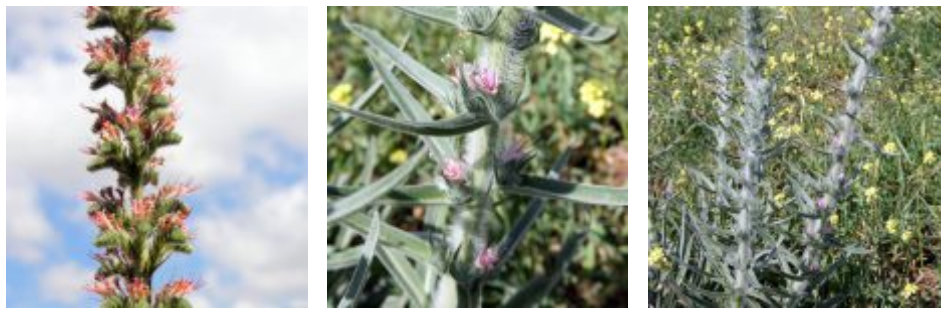
עכנאי מגובב - פריחה. מימין לשמאל לפי הסדר - 1. תחילת הפריחה; 2. הפרחים בודדים בחיק עלים; 3. עמוד תפרחת בפריחה מלאה; 4. כותרת הפרח א-סימטרית, מאוּחה. האבקנים בולטים ועמוד העלי גבוה להגדלה - לחצו על התמונות

עכנאי מגובב נפוץ בבת-גידול שונים. הוא מצוי בקרקעות כבדות מוצפות בחורף, בגדות נחלים ומאגרי מים, על טרשי גיר רך ובזלת, בהרים וכן בצידי דרכים. הוא שכיח בנוף מצפון הארץ ומרכזה עד הרי יהודה. תפוצתו העולמית היא ארצות מזרח הים התיכון.