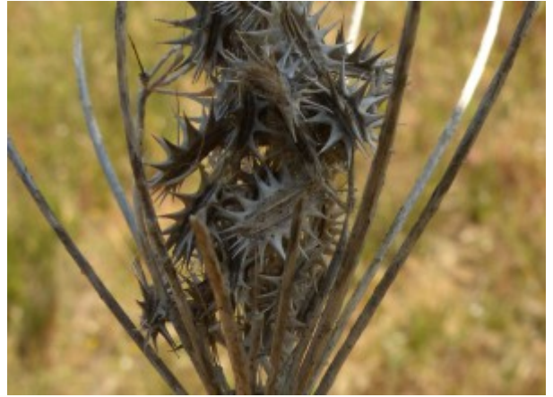
גזר החוף - שלד הצמח היבש עם הפירות. להגדלה - לחצו על התמונות

חולות יציבים הם בית הגידול האופייני של גזר החוף , בעיקר לאורך מישור החוף, אך הוא גדל גם בחולות הנגב המערבי. תפוצתו העולמית היא במזרח אגן הים-התיכון.