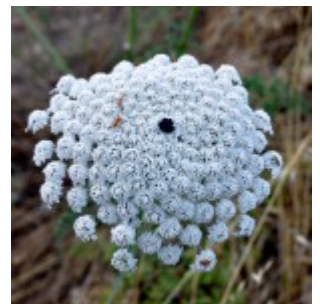
גזר קיפח