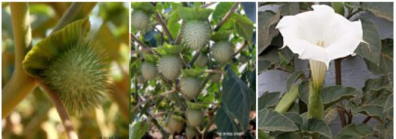
דטורה נטוית-פרי.

מימין - פרח בשיא הפריחה; במרכז ומשמאל - הלקטים נטויים כלפי מטה, בבסיסם חלק מהגביע. להגדלה - לחצו על התמונות