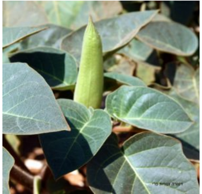
דטורה נטוית פרי - עלים וניצני פרחים, הניצן עטוף בגביע.