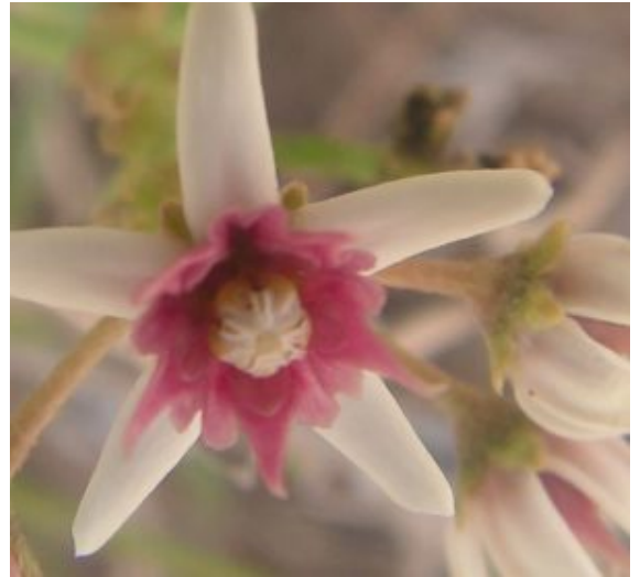
חנק מחודד. מימין - הצלקת המחומשת, מחולקת ל-10 אונות צרות; משמאל - מפוחיות. אחת סגולה ומאונקלת, ומתחתיה שתיים ירוקות וישרות להגדלה - לחצו על התמונות

חנק מחודד נפוץ בארץ בבתי גידול לחים - מקווי מים זורמים או עומדים ברוב חודשי השנה. החנק נפוץ בצפון הארץ ומרכזה ונדיר באזורים המדבריים, שם הוא מצוי בנאות מדבר. בנגב הצפוני הוא הפך לצמח טורדני בפרדסים ומטעים. בעולם חנק מחודד גדל בר בבתי גידול לחים ונאות מדבר במדינות צפון אפריקה, המזרח התיכון, דרום אירופה וחלקים נרחבים במערב ומרכז אסיה. מין זה הוא מהמינים הבודדים בתת-משפחת האסקלפיים בכלל ובסוג חנק בפרט, הגדלים באזורים הממוזגים. תת-מין נפרד גדל בסיביר.