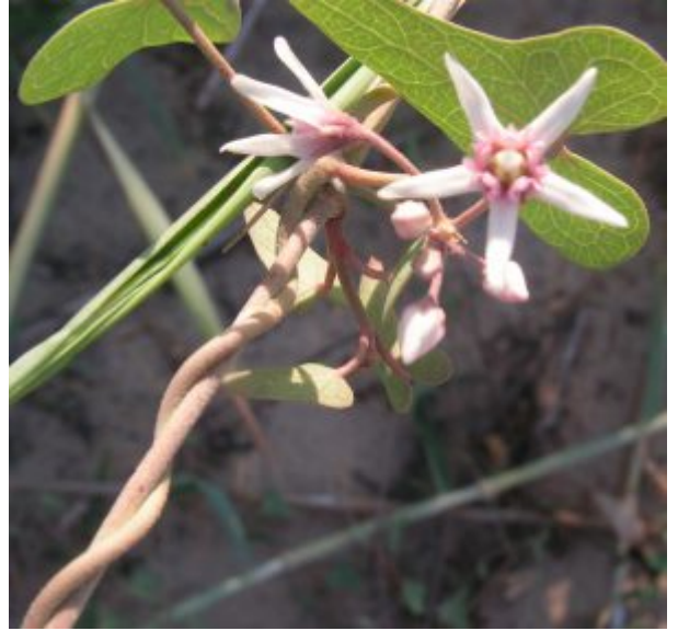
חנק מחודד. מימין - גבעול הנכרך סביב גבעול אחר של הצמח; משמאל - פריחה. עלי גביע משולשים ומאוחים בבסיסם, עלי הכותרת לבנים ומוארכים, האבקנים מאוחים ויוצרים עטרה סביב עמוד העלי להגדלה - לחצו על התמונות

חנק מחודד פורח בקיץ ובסתיו בחודשים יוני עד אוקטובר. בעת הפריחה יוצא ממפרקי העלים עוקץ פריחה המתפצל בדרך כלל לשני ענפי משנה כשבכל ענף משנה ישנה תפרחת דמוית אשכול או סוכך שבה כ-10 פרחים. לפרחים 5 עלי גביע קצרים ומשולשים המאוחים בבסיסם ו-5 עלי כותרת לבנים מוארכים ומפורדים. קוטר הפרח כ-1 ס"מ. חמשת האבקנים מאוחים ויוצרים עטרה סביב עמוד העלי, צבע העטרה לבן או סגול/ורוד. שני עמודי עלי מאוחים זה לזה ובראשם צלקת מחומשת המתחלקת ל 10 אונות צרות. לעתים קרובות יוצאות בבת אחת מאות תפרחות והצמח עליו מטפס החנק נראה כולו פורח בלבן או בלבן סגול. הפרי מורכב משתי מפוחיות אך לרוב אחת מנוונת או חסרה. המפוחית גלילית, אורכה עד 20 ס"מ ומחודדת בראשה ובה זרעים רבים בעלי ציצית ארוכה המסייעת להפצתם ברוח למרחקים גדולים.