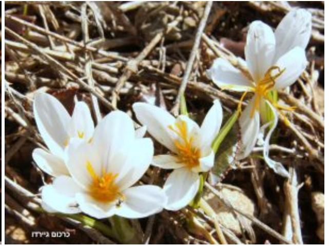
מימין - כרכום גירדו. משמאל - כרכום צהבהב. להגדלה - לחצו על התמונות