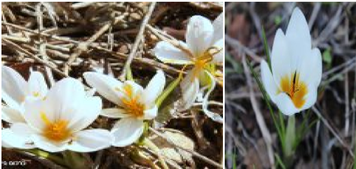
מימין - כרכום חורפי; משמאל - כרכום גיירדו.