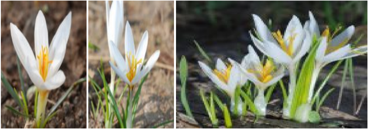
כרכום גיירדו חופי.

מימין - פרחים ועלים; במרכז - גוון סגול בחלק התחתון של העטיף; משמאל - הפריחה מתקיימת כאשר לצמח יש עלים. במרכז הפרח צלקת מפוצלת ואבקנים צהובים. להגדלה - לחצו על התמונות