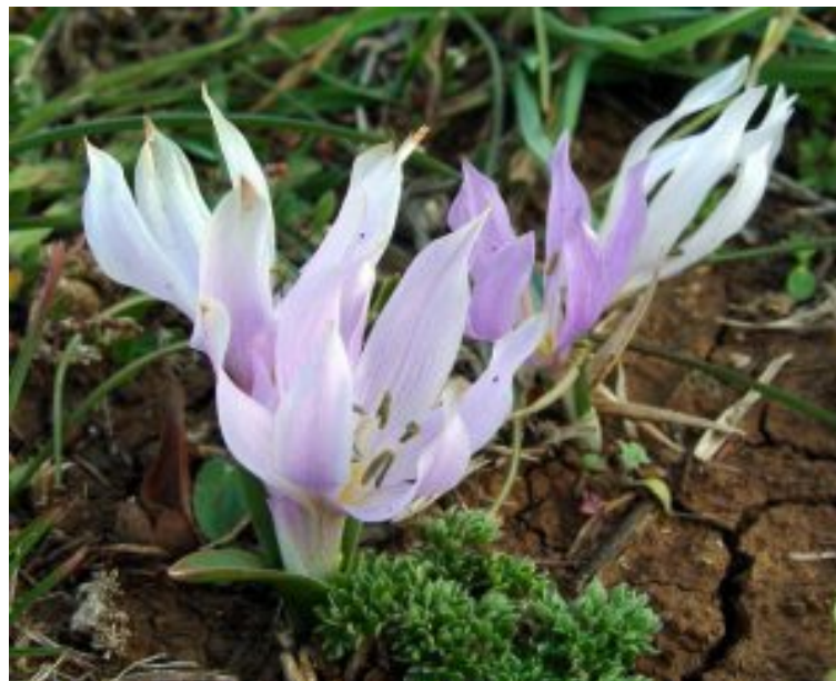
סתונית קצרת-עלים, מימין; משמאל - צמח מעמק מן בחרמון, צבע הכותרת נוטה ללבן.