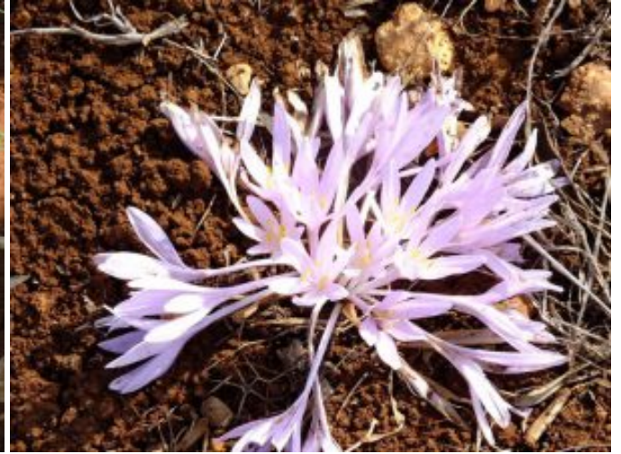
סתונית ירושלים. מימין - פרט ענק ובו כ 30 פרחים משמאל - עלים והלקט להנדלה - לחצו על התמונות