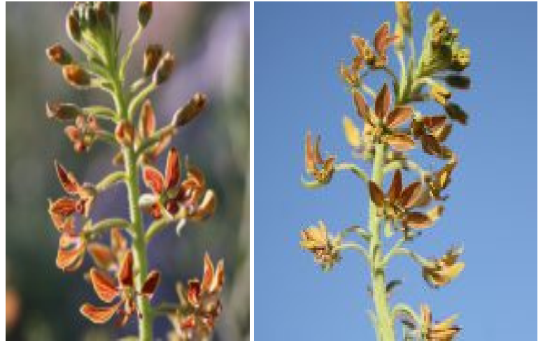
באשן תמים - תפוחת ופרחים. להגדלה - לחצו על התמונות

באשן תמים הוא צמח סודני הגדל בדרום הארץ בצידו דרכים, במדרונות, בוואדיות ובבתי-גידול מופרעים. שכיחותו רבה סביב ים-המלח, מצוי במדבר יהודה, בערבה ובהרי אילת.